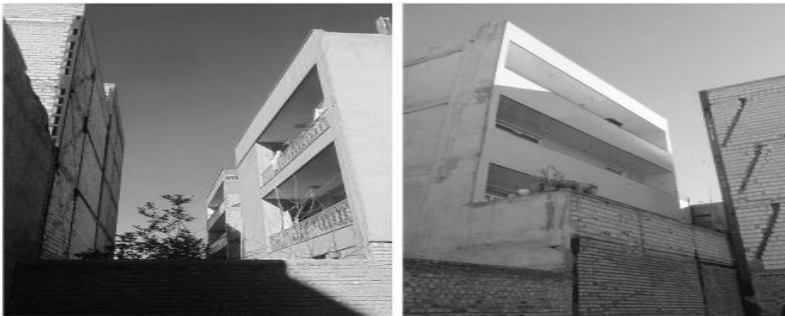
تصویر ۸: خانه‌های ردیفی و برون‌گرا (به‌عنوان یکی از پدیده‌های متأثر از لیبرال سرمایه‌داری) تناقضات متعددی با سبک زندگی اسلامی دارد که در مواردی همچون تضعیف حریم خصوصی به‌دلیل برون‌گرایی خانه، سایه‌اندازی خانه‌های پشتی بر جلویی، محدودیت رؤیت آسمان در اثر افزایش ارتفاع بدنه شمالی معابر و غیره بروز می‌یابد (ناری‌قمی، ۱۳۹۵: ۱۷)

اما به این نوع توده‌گذاری برون‌گرا و ردیفی، به‌رغم برخی مزایای اقتصادی (که قبلاً اشاره شد) نقدهای متعددی نظیر تضعیف حریم خصوصی ساکنین خانه، سایه‌اندازی خانه‌های پشتی بر حیاط خانه‌های جلو و محروم شدن آنها از نور آفتاب، محدودیت امکان رؤیت آسمان در معابر در اثر افزایش ارتفاع بدنه شمال معابر، تمایل صاحبان بنا برای خودنمایی بیش از حد به‌دلیل ردیف شدن نماها در کنار هم و غیره وارد است که همه این موارد در تقابل با الزامات سبک زندگی اسلامی می‌باشد. (تصویر ۸)