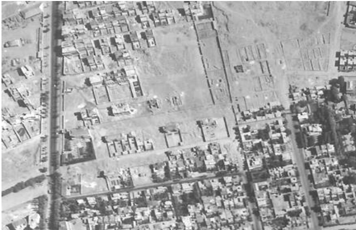
تصویر ۶: بخشی از تصویر هوایی تهران در سال ۱۳۳۵. به‌رغم آنکه ابنیه مسکونی در نیمه پایین تصویر، از الگوی درونگرا تبعیت کرده‌اند اما در نیمه بالای تصویر، ابنیه مسکونی تازه ساخت با توده‌گذاری برونگرا و ردیفی قابل مشاهده است که این امر نشان می‌دهد در این سال به تدریج الگوی برونگرا در ابنیه مسکونی شهر تهران در حال گسترش بوده است. ( http://sdi.tehran.ir )

عکس هوایی سال ۱۳۳۵ تهران (تصویر ۶) نشان می‌دهد که در این سال و حدود یک‌دهه پس از طراحی پروژه فوق، ساخت خانه‌های برونگرای ردیفی با رویه استقرار توده در منتهی‌الیه شمالی زمین‌های طویل و کم‌بر به رویکردی نسبتاً رایج تبدیل شده