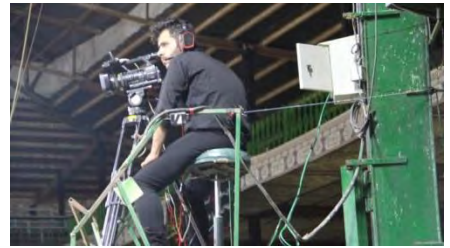
تصویر شماره (۷). واحد ثابت تصویربرداری در سالن اجرای حسینیة ابوالفضل العباس قودجان