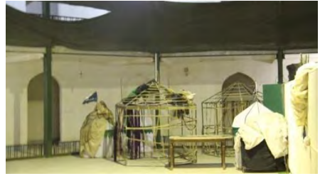
تصویر ۵. نگهداری تجهیزات نمایشی در سالن انتظار شبیه خوانان، حسینیة ابوالفضل العباس قودجان