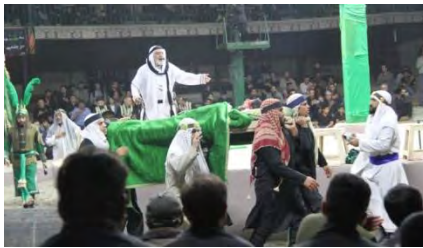
تصویر شماره (۱۰). تشییع پیکر امام علی علیه السلام ، همراه با نوحه خوانی شبیه خوانان و سینه زنی زائران در تعزیه شهادت امام علی علیه السلام (قودجان، ۱۳۹۸)