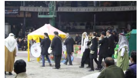
تصویر شماره (۱۱). گروه موسیقی و شبیه خوانان در حال ورود به سالن اجرا، صحنه آغازین تعزیه تولد امام حسین علیه السلام (قودجان، ۱۳۹۸)