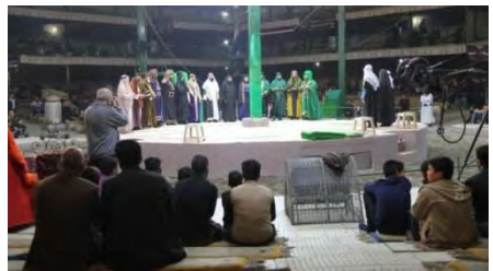
تصویر شماره (۹). استقرار شبیه خوانان بر روی سکوی اجرا هنگام «پیش خوانی» تعزیه شهادت امام علی علیه السلام (قودجان، ۱۳۹۸)