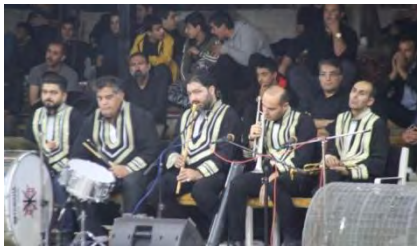
تصویر شماره (۸). گروه موسیقی مجالس تعزیه قودجان (۱۳۹۸)