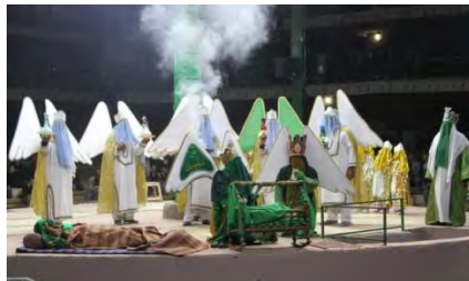
تصویر شماره (۱۲). صحنه ای از تعزیه تولد امام حسین علیه السلام ، تجمع فرشتگان پیرامون گهواره امام حسین علیه السلام (قودجان، ۱۳۹۸)