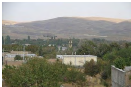
تصویر ۱. دورنمای روستای قودجان و حسینیه ابوالفضل العباس علیه السلام ، موقعیت جغرافیایی: 33^{\circ}17'07.4''N 50^{\circ}19'08.6''E