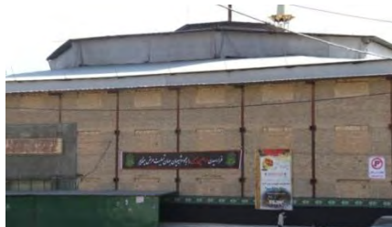
تصویر ۳. نمای بیرونی سالن اجرا، حسینیه ابوالفضل العباس قودجان