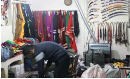
تصویر ۶. لباس خانه حسینیة ابوالفضل العباس قودجان