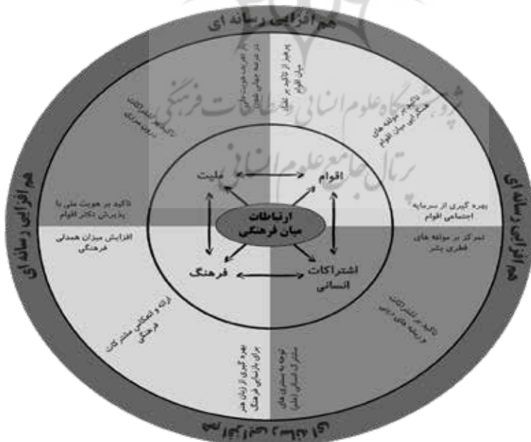
Figure 2. Model of different dimensions of the role of national media in increasing cultural communication