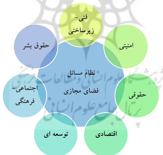
شکل ۴: نظام مسائل فضای مجازی

با استفاده از طبقه‌بندی جامعی با عنوان سبدهای دیپلو ۱ (Kurbalija, 2016, p. 25) می‌توان مسائل فضای مجازی را در هفت دسته ۱- فنی-زیرساختی ۲- امنیتی ۳- حقوقی ۴- اقتصادی ۵- توسعه‌ای ۶- اجتماعی- فرهنگی و ۷- حقوق بشر طبقه‌بندی کرد. این طبقه‌بندی از سال ۱۹۹۷ توسعه‌یافته و به‌طور منظم مبتنی بر بازخوردهای شرکت‌کنندگان در دوره‌ها، داده‌کاوی‌ها، نتایج پژوهش‌ها و ادراکات ناشی از فرایند خط‌مشی تعدیل‌گردیده است. این رویکرد، جمعی بین رویکردهای ذکرشده ایجاد نموده و از جامعیتی نسبی برخوردار است (Kurbalija, 2016, p. 30). از آنجایی که هدف از این کار تسهیل فهم حوزه پیچیده فضای مجازی است، لازم به ذکر است که این‌گونه طبقه‌بندی‌ها جهت آسان شدن درک موضوع بوده و ممکن است که بسیاری از مسائل در شرایط واقعی، ترکیبی از این طبقات را داشته باشند و یا اینکه با یکدیگر متقاطع باشد (CSTD, 2015, p. 5). همچنین پرواضح است که این طبقه‌بندی‌ها قابل تکامل و رشد بوده و منحصر به مسائلی که به آن‌ها پرداخته می‌شود، نیست.