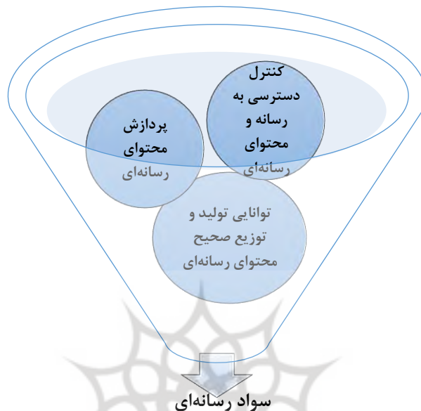
شکل ۱: مضامین فراگیر سواد رسانه‌ای

از سوی دیگر، شرایط کنونی در زمینه اثرات، فرآیند، ابزارها و غایات فضای مجازی، ما را بیش از آنچه در این سه مضمون فراگیر سواد رسانه‌ای است، درگیر و وابسته به خود کرده است و موقعیتی پیچیده‌تر و مؤثرتر بر زندگی جوامع بشری را رقم زده است و تصور می‌شود، سوادی که ضرورت دانستن و گسترش آن میان آحاد جامعه بیش از پیش است، مفهومی به نام سواد فضای مجازی است. در ادامه ضمن تعریف فضای مجازی، به تشریحی از مسائل و سواد مورد نیاز آن پرداخته خواهد شد.