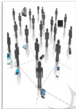
شکل ۲: تصور درست از فضای مجازی (آزادی، ۱۳۹۷، ص. ۱۶۶)

پس می‌توان گفت شبکه، به‌نوعی ابزار و ادواتی از سنخ فناوری اطلاعات و