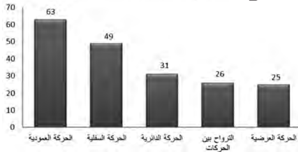
تعداد الحركات المكانية في شعر أدونيس

ظلّ ايقاع هاجس التغيير والنهضة أو الولادة الجديدة عالياً ومهمناً في مسيرة هذا النص منذ لحظة الشروع، تطلع الشاعر إلى الحرية، ورأى الشاعر أنّ التغيير يبدأ باستئصال وتدمير ما يجب إبادته، ثم إعادة البناء من جديد، أو تكوين قيم جديدة. كان التحول منثقاً من الحركة التصعيدية إلى محاولة البحث عن الذات، واستعادة الثقة بالنفس ممثلاً ولادة دائمة حتى في السقوط والموت ونجد الشاعر بلجاً إلى تكرار الحركة العمودية للمكان في المقطع في العبارة " وَتَصِيرُ الْخُلْمُ لُونًا فِي سَلْمِ الْأَبْرَاجِ " مبيّناً كراهته الواقع المتردي الذي يعيش فيه مجتمعه، والتعبير عن رفضه المستمر، وإلحاحه على الثورة والتغيير نحو الأفضل في المستويات كافة. والمخطط البياني الآتي يبيّن تدرّج الحركات المكانية في شعر أدونيس مع التركيز على ديوان "التحوّلات والهجرة في أقاليم النهار والليل" وديوان "المسرح والمرايا":