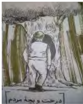
تصویر شماره ۱. میری در آستانه حفره درخت

بنابراین درخت در محور جانشینی با مادر قرار گرفته است؛ یعنی راوی طی سازوکار دفاعی - روانی «جابه‌جایی» به صورت ناخودآگاهانه درخت را جانشین مادر کرده است.