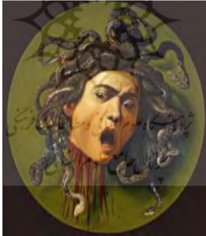
شکل شماره ۲. سر مدوسا اثر کارواجیو (۱۵۹۸)

(پسر زئوس ۱ و دانائه ۲ ) در اثر توطئه گری پولیدکتس ۳ - حاکم ستمگر شهر - مجبور شد برود، سر مدوسا را ببرد و به نزد پولیدکتس بیاورد. پرسئوس وقتی متوجه شد، به محض نگاه به مدوسا حتی اگر شمشیر هم داشته باشد، سرجایش سنگ خواهد شد، از بریدن سر مدوسا ناامید شد. تا اینکه آتنا، هرمس ۴ ، هادس ۵ ، هسپریدس ۶ و زئوس به یاری او آمدند. هر یک عنصری یاری دهنده به پرسئوس دادند؛ از همه مهمتر سپری صیقل یافته همچون آینه بود که آتنا به او داد تا در هنگام حمله مستقیماً به مدوسا نگاه نکند؛ بلکه در آیینگی سپر، تصویر مدوسا را ببیند و از طریق بازتاب تصویر، او را مورد حمله قرار دهد. پرسئوس پس از قطع سر مدوسا، وقتی به شهر بازگشت؛ از ازدواج پولیدکتس با مادرش - دانائه - آگاه شد. به دربار رفت. سر مدوسا را رو به پولیدکتس و درباریانش گرفت و همه آنها (از جمله ناپدری اش) با دیدن سر مدوسا سنگ شدند. سپس سر مدوسا را روی زره آتنا گذاشت تا دشمنان از او بگریزند. (همیلتون ۱۳۷۶: ۲۰۱-۱۹۱)