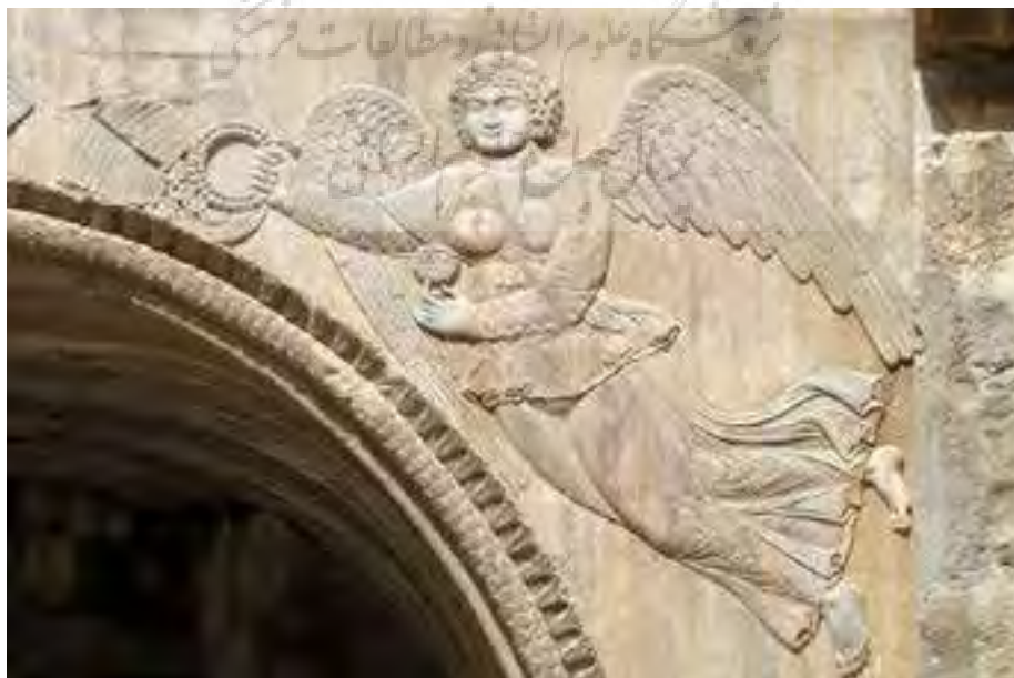
Figure 1. Farahvashi Winged Figure on the right side of Taq-e Bostan