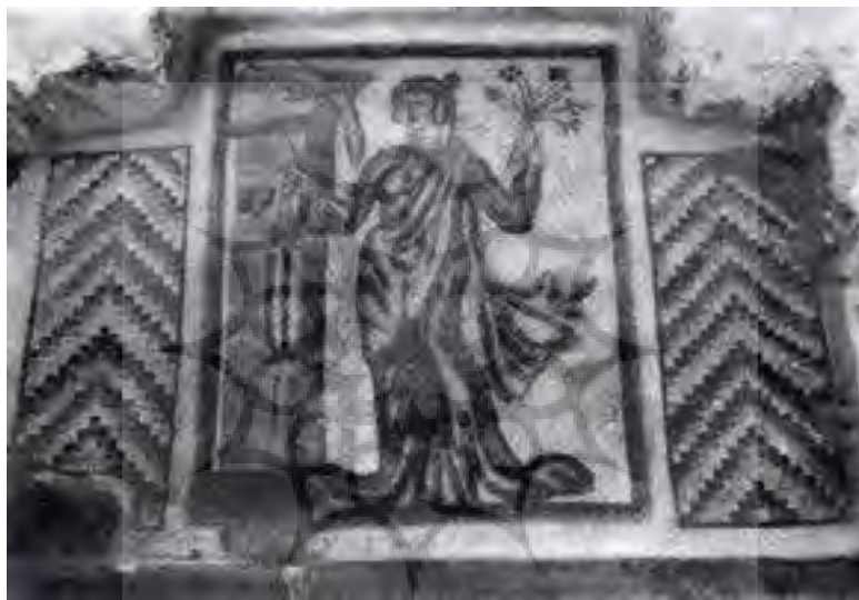
Figure 7. A woman holding a flower in a dramatic pose, Bishapur mosaics, museum of Ancient Iran (Ghirshman, 1999)

در یکی از موزاییک ها زن ساسانی بر روی دوش خود شال هایی دراز و بلندی را به صورت مورب از روی شانه راست تا پایین می انداخت و پیراهنی بلند و گشاد با آستین طراحی شده که در یکی از دست هایش تاجی از حصیر و دست دیگرش دسته گلی است. نقوش موزاییک های بیشاپور اگرچه مجریان آن ها رومی ها یا سوری های بوده اند، قطعاً جای تردید نیست که طراحی تصاویر موزاییک های بیشاپور توسط هنرمندان ایرانی - ساسانی طراحی و سپس هنرمندان رومی و یا سوری های آن ها را به موزاییک تبدیل کرده اند. این نقوش علی رغم تکنیک هنر موزاییک کاری رومی، اما تصاویر و نقش ها تماماً نشان از هنر ایرانی داشته و مطابق با خواست شاهان ایرانی ترسیم شده اند (Behraman, 2014). نقش زنان ساسانی در موزاییک های ساسانی نشان از یک نوع طرح با نام دراپه (حرکت ها یا چین های مایل پارچه بر روی بدن) برای فرم دادن به تن پوش خود استفاده می کردند. این ویژگی را در آثار متعدد ساسانی ها می توان مشاهده کرد. زنان با پیراهن های بلند و گشاد دارپه دار با آستین و بدون آستین طراحی شده اند که نشان از هنر خاص این دوره است. این نوع لباس های بلند مختص زنان اشرافی بوده است (تصویر ۷).