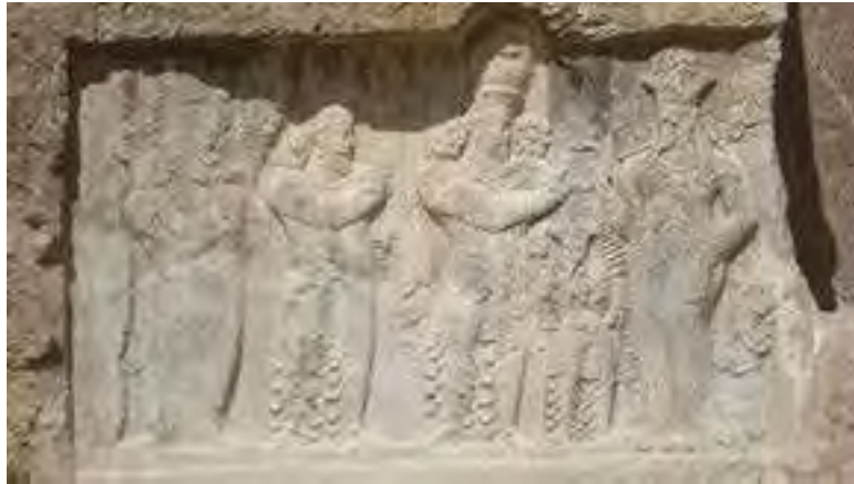
Figure 2. The relief of Narseh's Coronation by Anahita in Naqsh-e Rostam