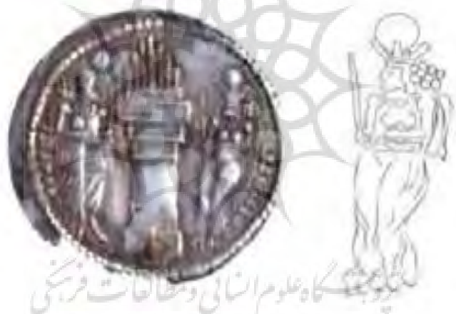
Figure 5. Coin of Artaxerxes with Ahanita (Avarzamani & Sarfaraz, 2015)