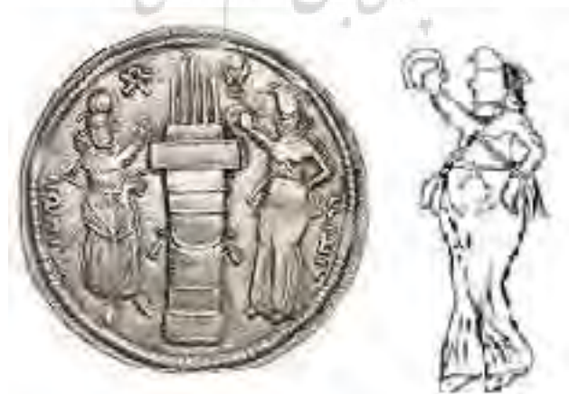
Figure 6. Coin of Bahram II with Ahanita (Avarzamani & Sarfaraz, 2015)