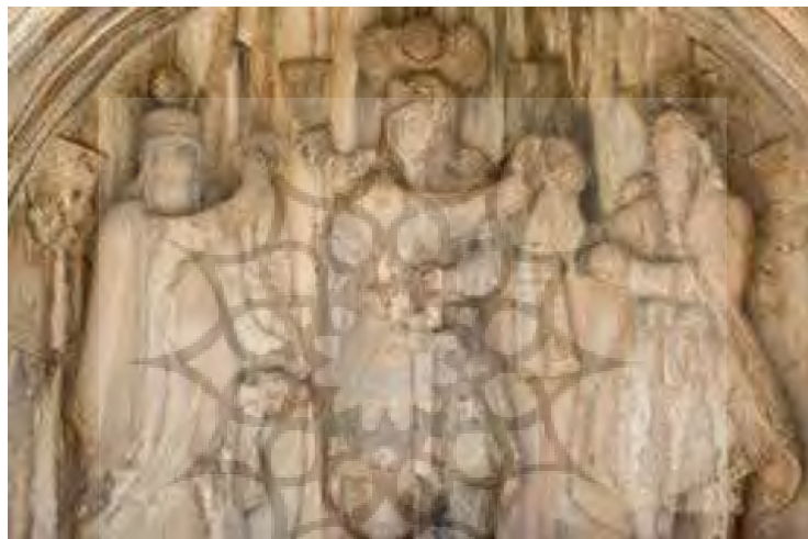
Figure 3. The relief of Khosrow II's Coronation by Anahita and Mitra in Taq-e Bostan