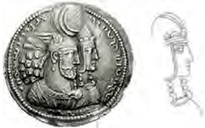
Figure 4. Coin of Bahram II with Shapurdukhtak (Avarzamani, 2014)

اهمیت بیشتری برخوردار است. هم‌چنین کمر بستن به مفهوم آماده به خدمت بودن در فرهنگ ایران جایگاه مستمر و ویژه داشته است (Sayyari, 2019). حاشیه بیرونی آستر پیکره نزدیک زمین است. نوک کلاه بی‌لبه زنانه روبان‌هایی کوچکی را حمل می‌کند، یک شئل کوتاه به‌طرز فوق‌العاده بر روی سینه با باندهایی به صورت متقاطع محکم شده است. لباس زنانه او را یک گردن‌بند و بازوبندی بر بالای دست کامل می‌کند. در سکه‌های ساسانی‌ها آن‌ها پوششی شبیه به ملکه نمایش داده شده است که نشان از تقدس خانواده سلطنتی دارد.