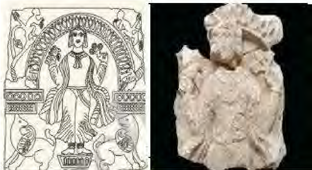
Figure 8. Sassanid molding of a Woman in Barze Qawale Archaeological Site, Kuhdasht, Lorestan (Mansoori & Karamian, 2012)