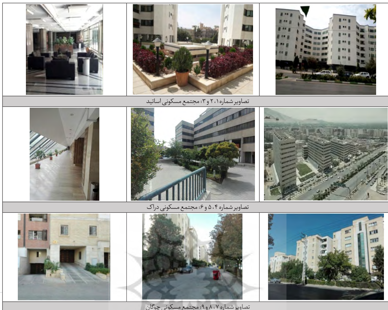
تصاویر شماره ۲، ۱ و ۳: مجتمع مسکونی اساتید