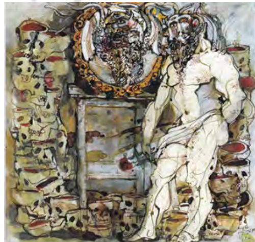
تصویر ۳. بدون عنوان، ۲۶×۲۵ سانتی‌متر، مرکب و گواش روی کاغذ، احمد امین‌نظر، ۱۳۷۵. منبع: (امین‌نظر، ۱۳۸۹: ۱۰۸)

در اثری دیگر از احمد امین‌نظر که از نظر سبک‌شناسی با رویکرد اکسپرسیونیستی خلق گردیده، موجودی با هیكلی عضلانی با سری به شکل دیو و چندچهره در وجوه مختلف و مارهایی که در شانه دارد به تصویر درآمده است (تصویر ۳). این موجود که در میان انبوهی دیدگانی متکثر قرار دارد و از شانه‌هایش هم مارهایی چندین‌گانه به برون سرب کشیده‌اند، مشغول نظاره‌ی انبوه دیدگان خویش و مارهای تکثیرشده‌ی مقابل آینه است. گویی، نگاه خودشیفته وار و نارسیس‌گونه‌ی وی موجب