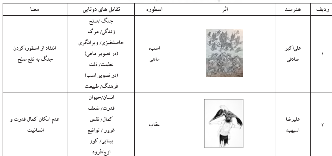
جدول ۱. کارکرد جامعه‌شناختی اسطوره در آثار نقاشی هنرمندان نقاش معاصر ایران.

به نظر می‌رسد هنرمند در تقابل دوتایی زن و مرد به برتری زن بر مرد اشاره دارد. زن در تابلوی او به نمادی از تعادل و آرامش و صلح و زیبایی تبدیل شده است. اما در مقابل مردان در پس‌زمینه، تیره و خاکستری، در حالت مورب به تصویر کشیده شده‌اند که هم نشانه‌ی تهاجم و هم عدم ایستایی و تعادل است. در دست زن پر لطیف طاووس است ولی در