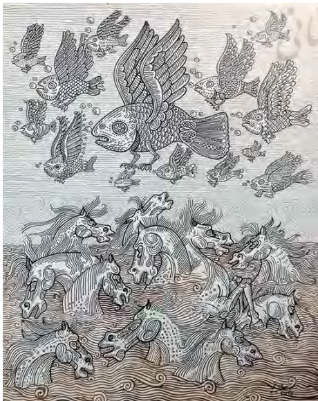
تصویر ۱. قطعه‌ی ۳۰ از مجموعه‌ی قطعات سفر، ۳۰×۴۵ سانتی‌متر، مرکب روی کاغذ، ۱۳۹۲.

در تصویر (۱) تابلوی قطعه ۳۰ یکی از ویژگی‌های بارز نقاشی‌های علی‌اکبر صادقی دیده می‌شود: وارونگی. «هر وارونگی چیزی هست که اصالت را نفی می‌کند. چیزی ویران شده، به غربت افتاده، بی‌خوشتن شده، بیهوده و بطلان‌یافته» (عمران، ۱۳۸۵: ۵۱). در این اثر نیز وارونگی در قالب ماهیانی دیده می‌شود که در آسمان هستند و اسب‌هایی که در آب ماهی که «به‌طور کلی، نماد حاصل‌خیزی و باروری که در آغاز همراه با مادر-الهه بود» (هال، ۱۳۸۰: ۱۰۰). و می‌تواند زندگی‌بخش باشد در این تابلو هم چون هیولاهایی آسمانی با بال‌هایی تومند و پنجه‌هایی قوی در حالت هجوم و عامل نابودی دیده می‌شود. حباب‌های آبی که از دهان این ماهیان پرنده خارج می‌شود هم چون گلوله‌هایی مرگ‌آساست که از