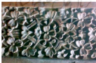
–صندوق بقعه شیخ صفی نقش ختایی دوره تیموری اواخر قرن هشتم هجری قمری