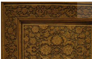
–در بقعه محمد کیا نقش ختایی دوره صفوی ابتدای قرن یازدهم هجری قمری

تصاویر شماره (۱) نمونه نقوش ختایی بر آثار تاریخی منبت ایران