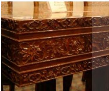
-نقش اسلیمی و ختایی قید میز تهران: موزه هنرهای ملی