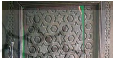
-منبت نقوش هندسی دوره قاجار فیروزکوه: امامزاده عبداله