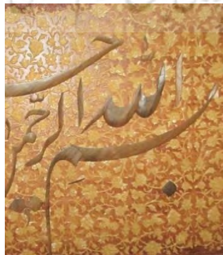
-تذهیب با نقش ختایی - تهران: محمد احسان دوست ۱۳۹۱ خورشیدی