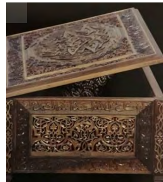
-نقش تذهیب گونه بر جعبه قرآن رضا جعفرلو ۱۳۸۷ (مأخذ: هنرمند)