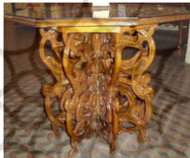
-میز هشت وجهی با نقش اسیمی تهران: موزه هنرهای ملی