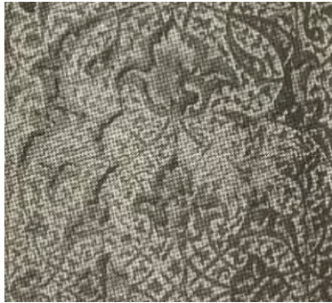
-در بقعه محمد حنفیه نقش اسلیمی ابتدای قرن یازدهم هجری قمری (مأخذ: ستوده ۱۳۶۲: ۱۶۲)