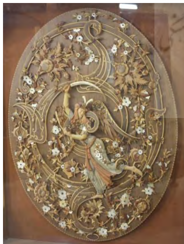
-تابلوی سنت شکن میرطیبی ۱۳۸۵