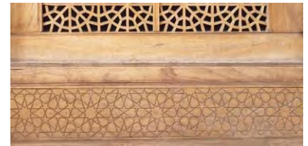
-منبت حکاکی با نقش هندسی کاشان، ارسی خانه عامری های (مأخذ: امرائی ۱۳۹۱: ۱۲۶)

پژوهشگاه علوم انسانی و مطالعات فرهنگی پرتال جامع علوم انسانی