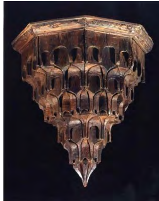
-نمونه مقرنس چوب- سایت موزه هنر اسلامی