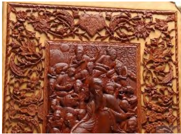
-کتاب حافظ - تهران: مهدی طوسی ۱۳۷۵ (مأخذ: هنرمند)

تصاویر شماره (۴) نمونه نقوش تذهیب بر آثار منبت