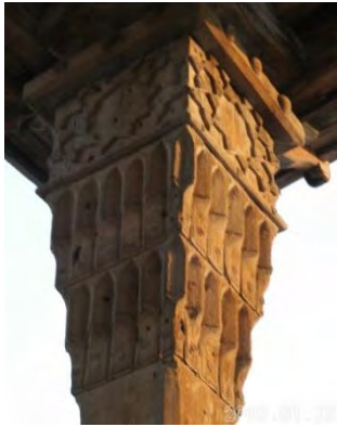
-سرسون عمارت عالی قاپوی اصفهان دوره صفوی