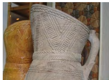
-نقوش هندسی کنده کاری مازندران: عبدالله گلردی دهه ۸۰ (مأخذ: امرائی ۱۳۹۱: ۱۴۳)