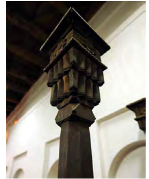
-منبت هندسی سه بعدی مسجد جامع ابیانه