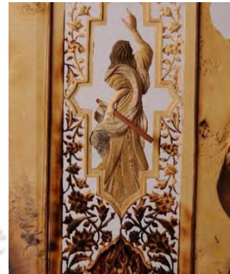
-ابراهیم در آتش - تهران: محمدرضا گرامی ۱۳۸۵ (مأخذ: هنرمند)