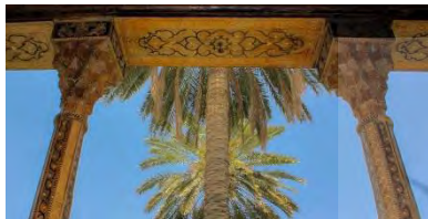
-سرسون مقرنس چوب قاجار شیراز: نارنجستان قوام