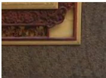
-حکاکی نقش هندسی تهران: مهدی طوسی دهه ۸۰ (مأخذ: هنرمند)