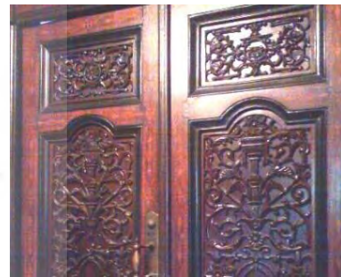
-در منبت کاخ گلستان با نقوش فرنگی دوره قاجار