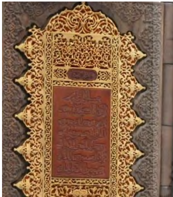
-تذهیب بر کتاب قرآن - تهران: مهدی طوسی ۱۳۸۶ خورشیدی (مأخذ: هنرمند)