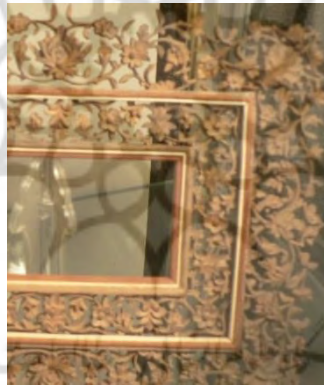
-نقش تذهیب بر قاب - اصفهان: محمد نصر ۱۳۸۳ خورشیدی (مأخذ: نگارنده)