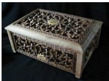
-جعبه مشبک منبت با نقش هندسی تهران: زهرا جلالی دهه ۸۰ (مأخذ: هنرمند)