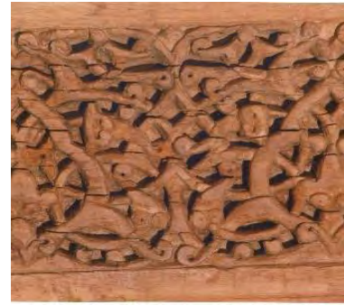
-زنده گنبد سلطانیه نقش اسلیمی ابتدای قرن هشتم هجری قمری