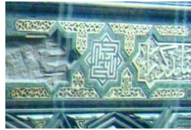
-صندوق بقعه شاه اسماعیل اول- اردبیل، قرن ۱۰ هجری.