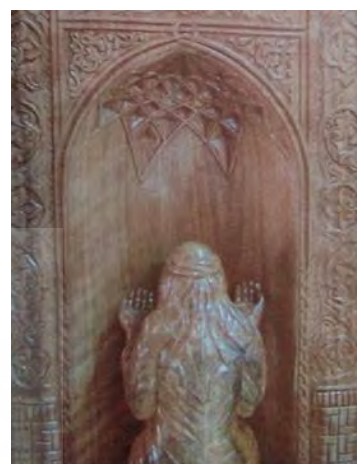
-نقش هندسی یزدی بندی تهران: علی آبشاری ۱۳۸۲ (مأخذ: امرائی ۱۳۹۱: ۱۳۲)