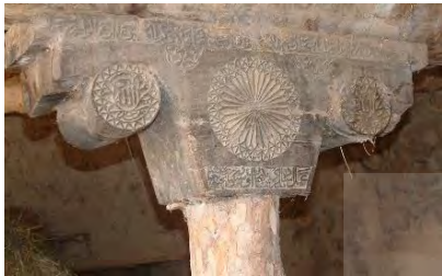
- منبت الماس تراش مازندران: اواخر قرن دهم هجری