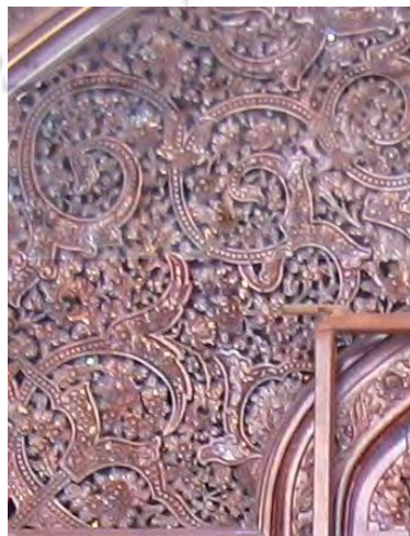
-نقوش سنتی، امامزاده صالح، صنعی ۱۳۶۶