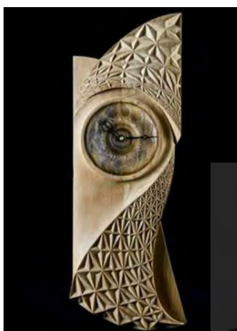
-منبت نقش الماس تراش محمدعلی ودود دهه ۹۰ (مأخذ: هنرمند)