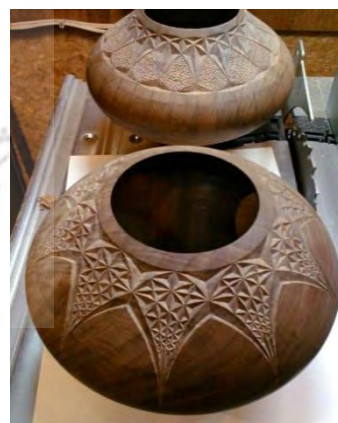
-نمونه منبت الماس تراش، ودود دهه ۹۰