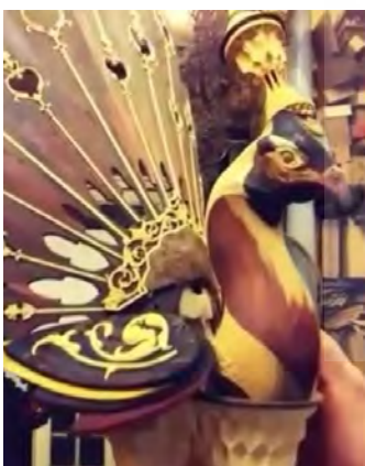
-منبت نقش هندسی بر سینه و تاج پرنده، ودود دهه ۹۰