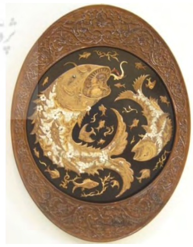
-تابلوی یونس در دهان ماهی میرطیبی ۱۳۶۵