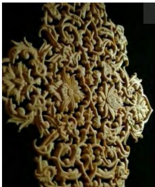
-نقش تذهیب بر منبت- تهران: سمیه مشایخی ۱۳۹۶ خورشیدی