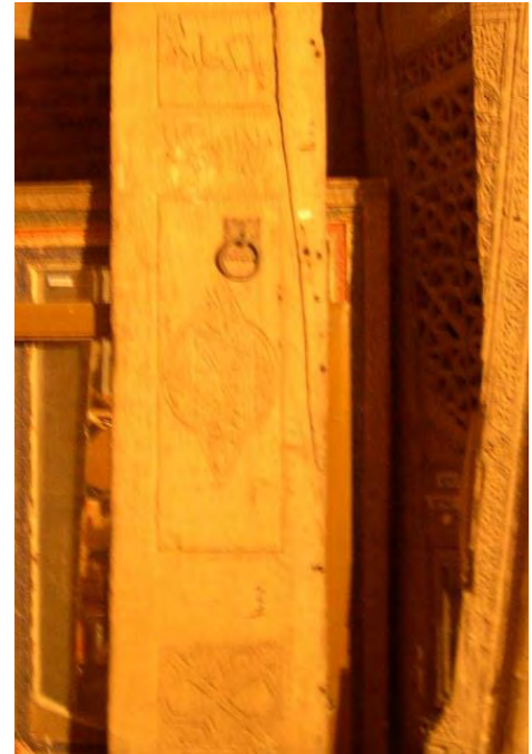
- منبت هندسی در شیراز: مسجد عتیق نیمه دوم قرن سوم هجری (مأخذ: امرائی ۱۳۹۱: ۳۶)

پژوهشگاه علوم انسانی و مطالعات فرهنگی پرتال جامع علوم انسانی