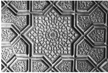
- منبت گره منبر مسجد بوانات نیمه دوم قرن هشتم موزه دوران اسلامی