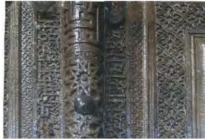
- منبت گره بایزید بسطامی ابتدای قرن هشتم هجری (مأخذ: امرائی ۱۳۹۱: ۴۶)