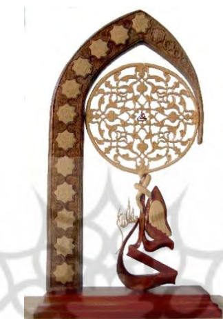
-نقش هندسی محراب و شمشه هشت امرائی ۱۳۸۲