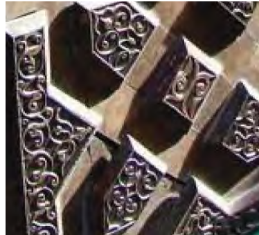
-صندوق بقعه سید علی-کیاسر نقش اسلیمی نیمه اول قرن نهم هجری قمری