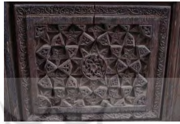
- منبت هندسی، پلان بندی در مقبر شاه اسماعیل قرن هشتم