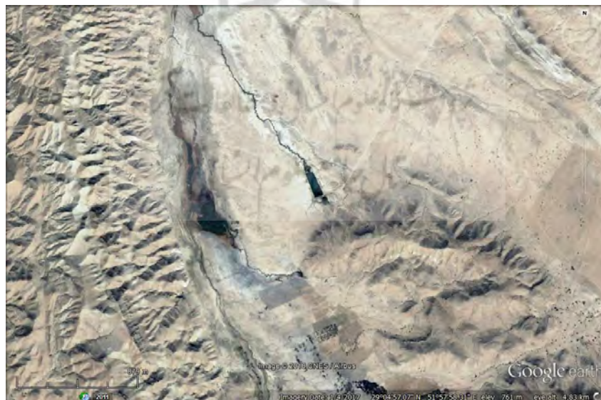
تصویر ۵: چشمه‌های آبگرم نوجین در نزدیکی سرمشهد. (مأخذ: google earth).

استخری، مقدسی، یاقوت حموی، مستوفی و حافظ ابرو، منابع آب شهر غندجان و دشت بارین و روستاهای این مناطق را چشمه، چاه و رودخانه معرفی می‌کنند. استخری به چشمه‌ای در یکی از روستاهای دشت بارین اشاره می‌کند و می‌نویسد: «به دشت وارین دهی هست آن را ماء نوح خوانند. آنجا چشمه آب هست. کی درد چشم را و علت علت‌ها را سود دارد و از حدود چین، خراسان آیند و از آن آب ببرند» (اصطخری، ۱۳۴۰: ۱۳۳). مقدسی نیز در رابطه با منابع آب از نهرهایی نام می‌برد که با توجه به توصیفات که ارائه می‌دهد به نظر می‌رسد این منابع، آبگرم معدنی و دارای گوگرد است که هم اکنون نیز در روستای نوجین و منطقه برگ شیرین در این محوطه جاری است. (تصویر ۵)