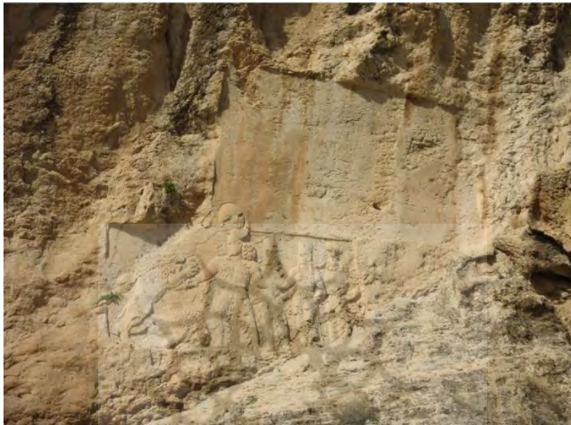
تصویر ۲: نقش برجسته دوره ساسانی. در منطقه سرمشهد فارس.

محوطه باستانی سرمشهد در یک دشت هموار و پهناور در میان دو رشته کوه قرار دارد. در شرق این محوطه کوهستان گچ‌دار بلوط با ۹۰۰ متر بلندی و در غرب آن نیز کوه سلَبک (سروک) با ۱۵۰۰ متر بلندا، قرار گرفته است. کوه‌های این منطقه از جنس آهکی و رسوبی است (ابراهیمی، ۱۳۸۵: ۱۲). تصویر شماره ۲، روایت‌گر بخشی از پیشینه تاریخی این منطقه و انتساب آن به دوره ساسانی می‌باشد.