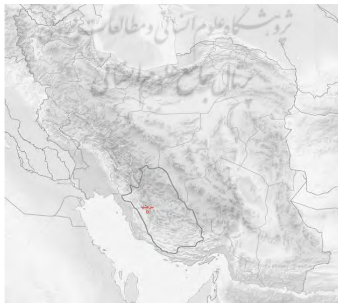
تصویر ۱: نقشه توپوگرافی ایران و موقعیت استان فارس و روستای سرمشهد

روستای سرمشهد در جنوب غربی استان فارس در دهستان دادین از بخش جره بالاده شهرستان کازرون (در فاصله ۷۵ کیلومتری جنوب شهر کازرون) و در ۳۰ کیلومتری غرب شهر بالاده مرکز بخش جره و بالاده واقع گردیده است. محوطه شهر تاریخی سرمشهد با گستره نزدیک به ۶۰۰ هکتار، در ۴ کیلومتری روستای سرمشهد امروزی، در کنار روستای تل سامان به عرض جغرافیایی ۲۹.۱۵.۸ و طول ۵۱.۴۳.۵۴ مترو بلندی ۸۷۴ متر از تراز آب‌های آزاد واقع شده است (وندایی، ۱۳۹۳: ۱۷) (تصویر ۱).