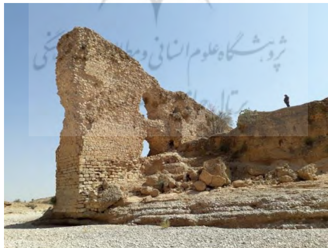
تصویر ۴: بقایای پل شکسته بر روی رودخانه جره