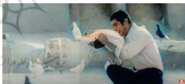
تصویر ۵. بام به عنوان بستری جهت ارتباط ساکنان با طبیعت، سکانشی از فیلم طوقی (کارگردان: علی حاتمی- سال ساخت: ۱۳۴۹). مأخذ: نماگرفت از فیلم طوقی.