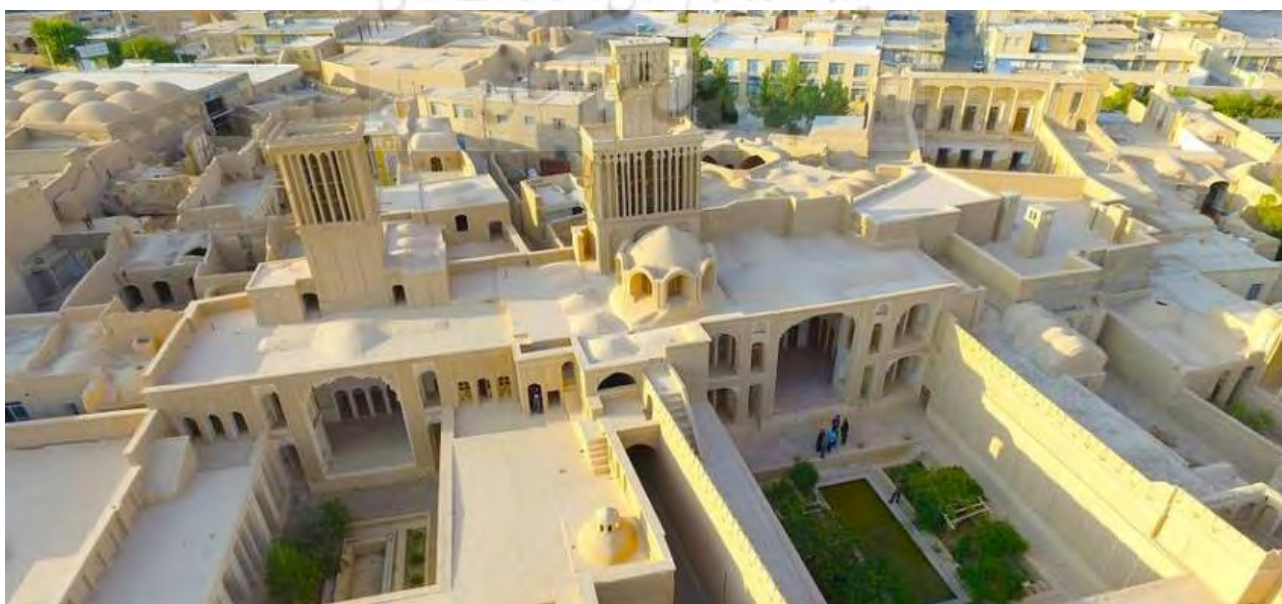
تصویر ۱۱. کیفیت‌های فضایی بام؛ بخشی از بافت مسکونی شهر ابرکوه.