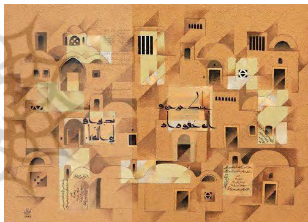
تصویر ۱. شاخص بودن فرم و تصویر هماهنگ از کلیت شهر در نقاشی پرویز کلاتری از یکی از شهرهای کوبری.

پررنگی که در تشکیل فرم و کالبد خانه‌ها، خط آسمان و در مقیاس وسیع‌تر، منظر و سیلوئت شهرها داشتند، به عنوان شاکله اصلی در ایجاد تصویر ذهنی و درک مشترک مردم و هنرمندان از شهر نقش‌آفرینی می‌کردند. سیلوئت شهر (سیاهه شهر)، تصویر کلی و فاقد جزئیات از شهر است که در متن زمینه و افق شهر دیده می‌شود. سیلوئت شهر، شامل خط آسمان نیز می‌شود (رستگاری و منصور، ۱۳۸۹). خط آسمان از مهم‌ترین عناصر سیمای شهری به شمار می‌رود و عاملی قوی برای هویت منظر است (همان). در شهرهای ایرانی اکثراً بام‌ها (شکل سقف‌ها) متأثر از عوامل اقلیمی، اجتماعی و فرهنگی بودند و هنجار شکل‌گیری بام در مناطق مختلف کشور در هماهنگی کامل با بستر شهری و منحصر بفرد و متفاوت از دیگر مناطق کشور بود. این پدیده باعث نظم ساختار ذهنی ساکنین می‌شد، هویت کالبدی شهر را شکل می‌داد، تصویری مانا و مشترک از شهر برای نسل‌های متوالی