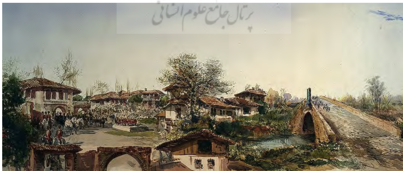
تصویر ۲. تأکید بر فرم و رنگ بام و تصویر هماهنگ شهر در نقاشی پاول پیاستسکی، نقاش روس، از شهر رشت.