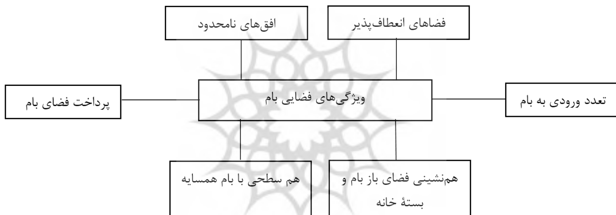
تصویر ۱۰. ویژگی‌های فضایی بام که نشان از نقش‌های هویتی، اجتماعی و ارتباط با طبیعت دارند.

فضاهای انعطاف‌پذیر: در عین توجه به کیفیت‌های فضایی از جمله ایجاد دسترسی مناسب، پرداخت فضاهای روی بام (از جمله بادگیر و خیش‌خون)، بام‌ها دارای فضایی انعطاف‌پذیر جهت فعالیت‌های گوناگون اهل خانه همچون صرف شام،