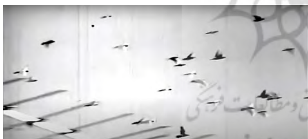
تصویر ۶. پرواز کبوترها در آسمان شهر و بر فراز بام‌ها، سکانشی از فیلم کاکو (کارگردان: شاپور قریب- سال ساخت: ۱۳۵۰).