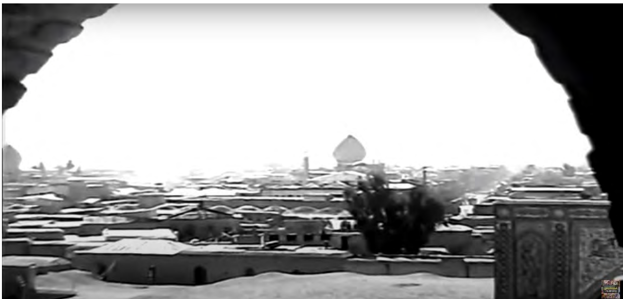
تصویر ۹. جایگاه بام‌ها در تصویر شهر در یکی از سکانس‌های فیلم قدیمی کاکو (کارگردان: شاپور قریب - سال ساخت: ۱۳۵۰).