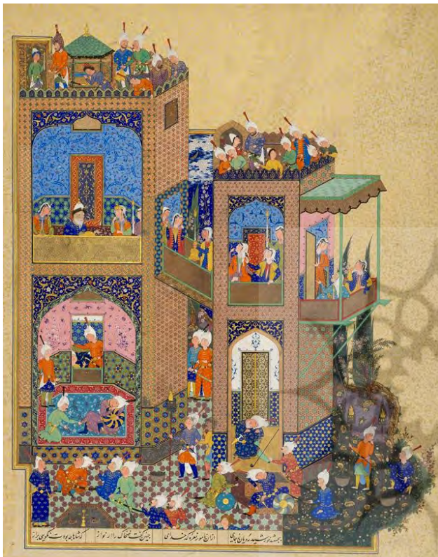
تصویر ۴. به تصویر کشیدن داستان ضحاک و کاوه آهنگر از شاهنامه فردوسی.