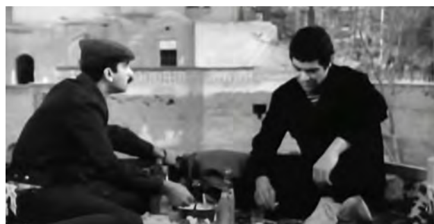
تصویر ۷. بام به عنوان فضای تعامل و صرف غذا در کنار هم، یکی از سکانشی‌های فیلم سینمایی غریبه (کارگردان: شاپور قریب- سال ساخت: ۱۳۵۱).