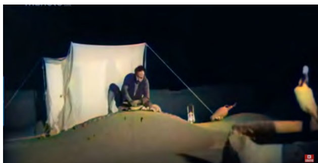
تصویر ۸. برپایی پشه‌بند و خوابیدن اعضای خانواده روی بام، سکانشی از فیلم طوقی (کارگردان: علی حاتمی- سال ساخت: ۱۳۴۹). مأخذ: نماگرفت از فیلم طوقی.