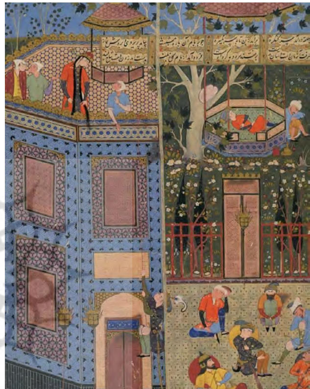
تصویر ۳. به تصویر کشیدن داستان زال و رودابه از شاهنامه فردوسی، رودابه برفراز بام.

تأکید کرد که سینما همچون بسیاری از رسانه‌های ارتباط جمعی از جمله عواملی است که بخشی از تخیل ما درباره شهر از طریق آن رقم می‌خورد و می‌تواند به تخیل ما در باب شهر سامان بخشد (رادورد و محمودی، ۱۳۹۴). لذا، یکی از منابع بسیار مهم جهت بازشناخت فضای بام و نقش‌های آن در شهرهای ایرانی و زندگی روزانه مردم، آثار سینمایی معاصر است چرا که بسیاری از آن‌ها در ارتباط با زندگی عامه مردم و وقایع جاری در خانه‌های آن‌ها بوده است. فیلم‌های سینمایی زیادی با محوریت فضای خانه، خصوصاً بام خانه‌های ایرانی در سینمای معاصر ایران ساخته شده است که چند مورد از آن‌ها همچون طوقی، غریبه و کاکو در این پژوهش مورد بررسی قرار گرفته است. از جمله صحنه‌های پرتکرار در این فیلم‌ها، صحنه‌های نشان دهنده پرواز دسته جمعی کبوترها بر فراز بام یا ارتباط ساکنان خانه با کبوترهاست که از بارزهای نقش