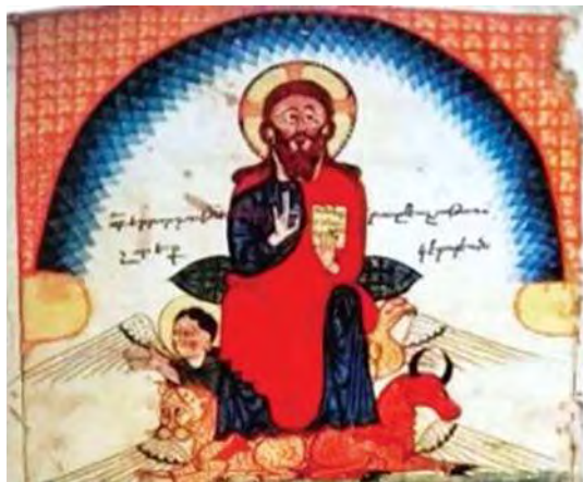
تصویر ۱۴.

اسطوره‌ها و افسانه‌ها روشنگر تقدیر قهرمان شدن است. از آنجاکه رویکرد یونگ به مسیح، رویکردی روان‌شناختی است، وی مسیح را نمادی تام از کهن‌الگوی خویشتن و تمامیت روان می‌داند: «مسیح نماد کاملی است از سرنمون خویشتن ۱ ، زیرا نمودگار همان صفات قهرمان اساطیری است داشتن پدر الوهی، تولد تصادفی و مخاطره‌آمیز، رشد و تحول زودرس، معجزات، مرگ، آوای فرشتگان، چوپانان و غیره بنابراین همین صفات مسیح است که از او تجسمی از خویشتن می‌سازد» (مورنو، ۱۳۸۰: ۱۱۵).