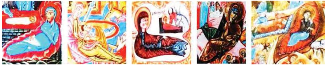
تصویر ۶. بخشی از تصاویر تولد