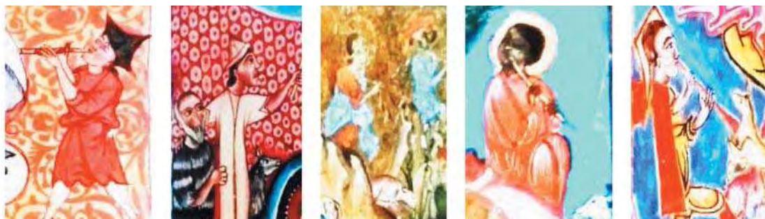
تصویر ۸. بخشی از نگاره‌های تولد، مأخذ: همان

اهمیت آن‌ها در شمائل نگاری کلیسایی است این حیوانات مارابه یاد سخنان اشعیا می‌اندازد: «گاو صاحب خود را می‌شناسد والاغ تخت سرور خود را می‌شناسد، ولی اسرائیل مرا نمی‌شناسد و مردم به من بی‌توجه هستند». فرشتگان در این تصاویر وظیفه‌ای دوگانه دارند برخی از آن‌ها به همدیگر آمدن مسیح را خبر می‌دهند و برخی به سوی پایین نگاه می‌کنند و تولد مسیح را به آدم‌ها مژده می‌دهند (تصویر ۷).