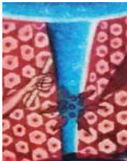
تصویر ۱۰. ستاره راهنما، قسمتی از تصاویر تولد.

پیدایش ناخودآگاه جمعی از روش عناصر سازنده آن یعنی کهن‌الگوها محقق می‌شود. از سوی دیگر، پیدایش کهن‌الگوها نیز از راه نماد ممکن می‌شود. یکی از پرتکرارترین کهن‌الگوها، تولد نمادین و غیرمعمولی قهرمان است که نشانگر گزینش او از سوی نیروهای ماوراء طبیعی است «تولد قهرمان اساطیری معمولاً حادث‌های غیرطبیعی است و در رازها نهان است. قهرمان از همایش دو واحد جنسی زن - مرد به وجود نمی‌آید و اگر هم از اندام زنی تولد یابد، این باردارشدن میوه عملی معجزه‌آساست» (پیزا، ۱۳۸۲: ۱۷۹). تولد نمادین حالت‌های گوناگونی دارد که هرکدام از نمادپردازی ویژه‌ای برخوردار است. قهرمان از مادری دوشیزه متولد می‌شود یا از پهلوی یا قلب مادر به دنیا می‌آید و یا اینکه عوامل نباتی یا فرا طبیعی در تولد او نقش دارند. «رسم براین است که افسانه‌پردازان، از لحظه تولد قهرمان و یا حتی از لحظه‌ای که در رحم مادر جای می‌گیرد، نیروهای شگفت و خارق‌العاده به او اعطا می‌کنند.