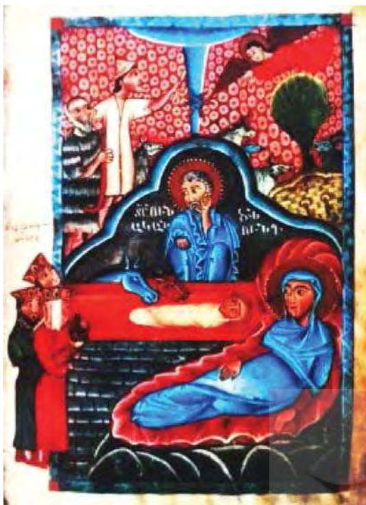
تصویر ۲. تولد مسیح انجیل مشابه به هواسن آناپات.

و خشت، پایک آسمان ستاره‌نشان، یک چشم انداز فانتری و معماری بالهت دیده می‌شود. فیگورها با چهره‌های گرد و بزرگ و چشمان کمی بادامی شکل دارند (یادآور الگوی مغولی که گاه‌وبیگاه در مجسمه‌سازی استان‌های سیونیک ۱ تولید می‌شوند). این فیگورها کمتر تغییر دارند هرچند از تجربیات گوناگون تقلید کرده‌اند ظاهراً بدون نوع و ابتکار به نظر می‌رسند. چین‌ها به‌طور عالی و روشی خاص حتی سیخ و مستقیم کشیده شده‌اند ولی از خط‌های اندام تبعیت می‌کنند و حالت فیگورها کاملاً مشخص است. زیاده‌روی در استفاده از موتیف‌های زینتی یکی از خصوصیات متمایز این نگاره (و دیگر نگاره‌های این انجیل) است. نفوذ زیورآلات داخل صحنه‌های مجازی، در مراحل ابتدایی درکارهای نقاش ایگناتیوس ۲ (آغاز قرن ۱۳ در منطقه آنی) دیده شده است. مربع‌های کوچک، دایره‌ها، چهارگوش‌های رنگی قرمز و نقاط سفید پراکنده در پس‌زمینه آبی فضای خالی اطراف فیگورها را می‌پوشانند. این سلیقه تزئینات بر شیوه تصویربرداری از منظره تأثیر می‌گذارد. تپه‌های سالی که مریم بر روی آن‌ها نشسته است، دیوار آجرچینی که در آن دو شکستگی هست که از آنجا دو چشمه آب بیرون می‌آید از الحاقات جدید در این انجیل (سبک) است. این همان ترکیب‌بندی است که در انجیل تصویر شده توسط مومیک ظاهر شده است اما در این تصویر مگی نشان داده نشده است به طوری که چیزی برای خیره شدن یوسف