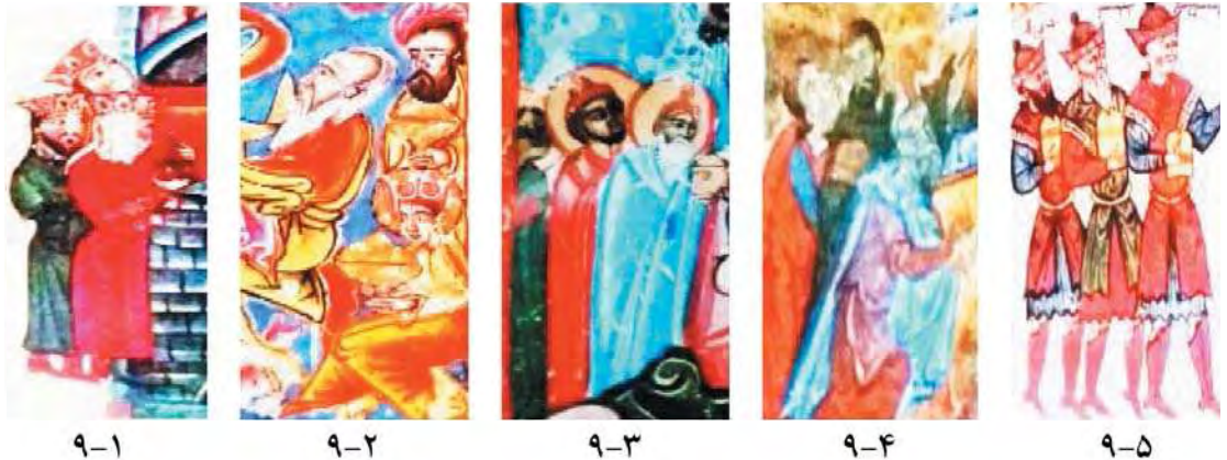
تصویر ۹. سه مجوسی، قسمتی از تصاویر تولد، مأخذ: همان.