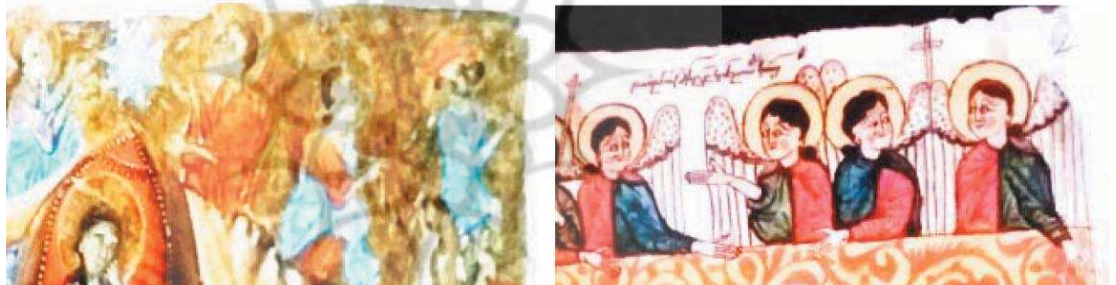
تصویر ۷. بخشی از نگاره‌های تولد