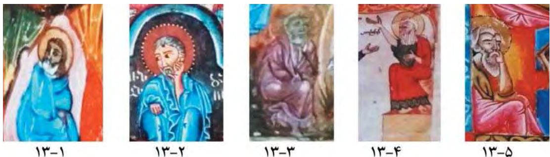
تصویر ۱۳. یوسف، قسمتی از تصاویر تولد.

کل زندگی قهرمان به‌صورت نمایشی باشکوه از معجزات تصویر می‌شود که نقطه اوجش ماجرای بزرگ مرکزی آن است» (کمبل، ۱۳۸۵: ۳۲۴). در اسطوره، حماسه و افسانه‌های ملل، «قهرمان چهره‌ای شناخته‌شده و مشهور است که یا خود خداست، یا برکرده خدایان است و در مواردی نیز حاصل آمیزش یکی از ایزدان و ایزدبانوان یا شاه و ملکه‌ای خاص به شمار می‌رود. بدیهی است که شخصیتی این‌چنین که در حوزه عملکرد اسطوره، قهرمان نام دارد، با ویژگی‌هایی خاص و در موقعیتی منحصر به فرد، تولدی اغلب اسطوره‌ای دارد و بار سنگینی از نمادهای اساطیری و کهن نمونه‌ای را به دوش می‌کشد. بدین ترتیب تعداد زیادی از شخصیت‌های اسطوره‌ای یا قهرمانان اساطیری، با الگوهای تکرار شونده تولد به دنیا می‌آیند. با نگاهی به این الگوها و بررسی موقعیت‌های سمبلیک و مشترک میان آنها می‌توان به این نتیجه کلی رسید که همواره یک خدا و الهه، شاه و ملکه و یا والدینی با سطح برتری از نظر نژاد و موقعیت اجتماعی، برای به دنیا آوردن کودکی انتخاب می‌شوند که در جهت تبیین اهداف اسطوره، تولدی از پیش تعیین‌شده و الگومند دارد» (شکیبی ممتاز، ۱۳۹۳: ۹۸). در داستان تولد عیسی مسیح، کودک از مادری متولد می‌شود (مریم) که برگزیده زنان دوران خود است و اولین زنی است که توانسته است وارد معبد شود. مریم در سوره آل عمران آیه ۴۲ لقب بانوی دوعالم بر خود گرفته است او کسی است که بر او وحی نازل شده است. در سوره آل عمران آیه ۴۵ چنین آمده است: «و فرشتگان مریم را گفتند: ای مریم خدا تو را برگزیده و پاک ساخته، و بر تمامی زنان دوجهان برتری داده است. ای مریم فروتنی کن برای