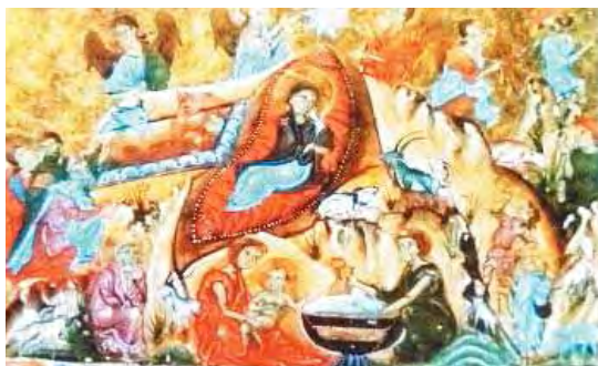
تصویر ۴. تولد مسیح. چهار انجیل قرن ۱۳.