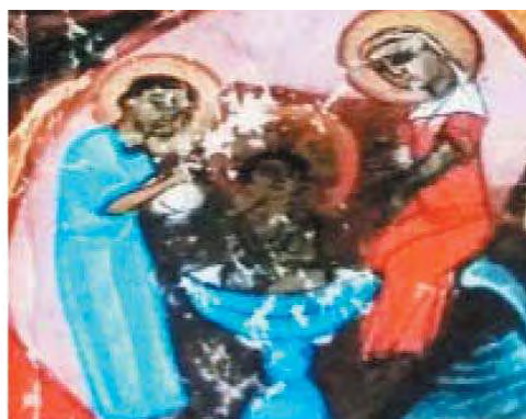
تصویر ۱۱. دو زن (ماما)، قسمتی از تصاویر تولد.