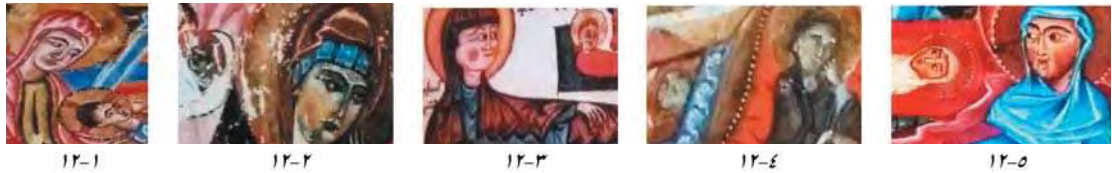
تصویر ۱۲. زاویه دید مادر و کودک.

پروردگار خود و سجده به جای آور و با نمازگزاران به نماز بایست». از نظر یونگ، قهرمان تولدی معجزه‌آسا و ساده دارد او قدرت فوق العاده‌ای از خود نشان می‌دهد که باعث ترقی او در جامعه می‌گردد» (اسنودن، ۱۳۸۹: ۱۰۴). یکی از این معجزات سخن گفتن مسیح در نوزادی است و معجزات دیگری که باعث می‌شود مردم به او و مادرش به دیده احترام بنگرند. این معجزات در قرآن سوره آل عمران آیه ۴۹ این‌گونه آمده است: و [او را به‌عنوان] پیامبری به‌سوی بنی‌اسرائیل می‌فرستد که به آنان می‌گوید در حقیقت من از جانب پروردگارتان برایتان معجزه‌ای آورده‌ام من از گل برای شما چیزی به شکل پرند می‌سازم آنگاه در آن می‌دمم پس به اذن خدا پرند می‌شود و به اذن خدا نابینایان مادرزاد و پیران را بهبود می‌بخشم و مردگان را زنده می‌کنم و شمارا از آنچه می‌خورید و درخانه هایتان ذخیره می‌کنید خبر می‌دهم.