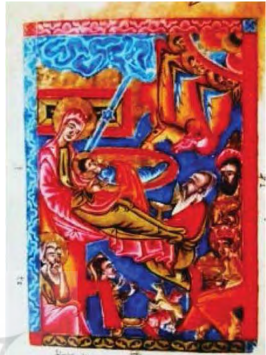
تصویر ۳. تولد مسیح، اصفهان (۱۶۰۷) - هاکوب از جلفا. مأخذ: همان: ۱۵۰

تصویر ۴ به چهار انجیل ربع سوم یا چهارم قرن ۱۳ تعلق دارد. کاغذ آن ضخیم ولی قابل ارتجاع، ۳۰۱ برجه در ابعاد ۴/۳۰ در ۲/۲۱ سانتی‌متر است. وضعیت این نسخه خطی، از وضعیت نمناک، تاندازه‌ای مطلوب است برگه‌های بالا و پایین که بازسازی شده سفید و در چرم پیچیده شده است. رونویس این اثر روبن و نقاشان آن چند نفر هستند که بی‌نام‌نشان مانده اند و صفحه عریضه‌ها گم شده است. متن انجیل، با جوهر مشکی، با خط بلراگیر، حروف ابتدایی و تزیینات حاشیه‌ای طلایی، قرمز و آبی کتابت شده است و نوارهای تزیینی به‌عنوان سر صفحه عنوان یا پاراگراف بالا یا میانه تصویر قرار داده شده است. سرستون و اول خط‌ها و پاراگراف‌ها طلایی، متن به‌طور میانگین ۲۱ خط که شامل مینیاتورهای کوچک و متوسط در داخل متن است. این انجیل به دوره شکوفایی هنر در این دوره تعلق دارد و نقاشان این مینیاتورها به خانواده هنری که دو نسخه خطی کلیکیه را در ربع سوم قرن ۱۳ به تصویر کشیده‌اند، متعلق می‌باشند. تصاویر این انجیل بعد از نوشته شدن متن در جاهایی که خالی گذاشته شده بود ترسیم شده اند که این یکی از مشخصات کارهای کلیکیه در قرن ۱۳ است.