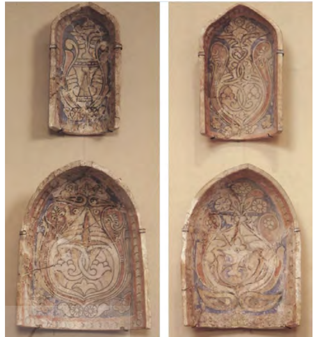
تصویر ۱۰. مقرنس‌های گچی رنگ‌شده، سبزپوشان، نیشابور، موزه متروپولیتن.

بخش عظیمی از نیروهای کار را در قرون نخستین شرق جهان اسلام بردگان و اسیران جنگی تشکیل می‌دادند. در واقع شواهد بسیاری از تجارت برده در شهرهای خراسان وجود دارد. محققینی همچون ایشپولر ۱ بر این اعتقادند که توسعه اجتماعی اقتصادی آن دوران بر پایه برده‌داری صورت پذیرفت. شواهدی از آموزش بردگان برای کارهای مختلف در شهرهایی همچون سمرقند ۲ ، خوارزم ۳ و سغد ۴ در دست است. این غلامان و کنیزان بسته به محل کارشان غلامان سرای یا غلامان بیرونی نام می‌گرفتند (ایشپولر، ۱۳۹۱، ۲۸۳). طیف عظیمی از این بردگان و اسیران هندو بودند. جنگ‌های متعدد در قرون نخستین اسلامی به‌خصوص جنگ‌های متعدد