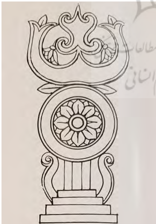
تصویر ۹. نماد تریراتنا برگرفته از نماد سه شاخه بر روی نماد چرخ.

این نماد گلدان پوشیده از برگ را به تصویر می‌کشد و نمایانگر کالاش است که متعلق به آیین هندو یا جین است (تصویر ۱۳). کالاش گلدان سفالی یا مسی است که پر از آب است و بالای آن از برگ انبه و یک نارگیل تشکیل شده است. کالاش دارای معانی نمادین بسیاری