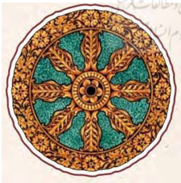
تصویر ۶. سمبل چرخ.

پرتکرار تمثال‌های بوداست که در بسیاری مجسمه‌های هند و افغانستان قابل مشاهده است.