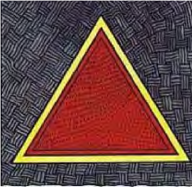
تصویر ۸. سمبل تریکونا.

از جمله آب‌های ابتدایی آفرینش، روح پر از عشق و دلسوزی، فراوانی و مهمان‌نوازی است. نارگیل نمادی از سر خداست و چشم نمادی از چشم ویشنو. کالاش در کلیه آیین‌های مهم هندو و جین وجود دارد و پایه و