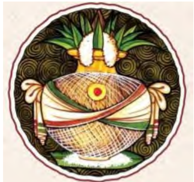
تصویر ۱۳. نماد کالاش.

یکی از اصلی‌ترین راه‌های گسترش و انتشار هنر در ادوار تاریخ مبادلات تجاری و شهرهایی بوده‌اند که به دلیل موقعیت تاریخی و جغرافیاییشان کانون تجمع اقشار مختلف مردم علی‌الخصوص بازرگان بوده‌اند. نیشابور از آنجایی که برای قرون متمادی مرکز حکمرانی سلسله‌های مختلف بود از موقعیت ممتازی در میان شهرهای شرق جهان اسلام برخوردار شد. در منابع تاریخی به بازارها و کاروانسراهای نیشابور اشارات متعدد شده است. بنا به گفته ابن حوقل، جغرافیدان قرن چهارم هجری، طیف وسیعی از صنوف و کاروان‌ها در کنار هم مشغول به کار بودند (ابن حوقل، ۱۳۶۶، ۱۶۸-۱۶۷). بنا به عقیده برخی محققین همچون لباف خانیکی هرچند جاده ابریشم قدمتی هزاران‌ساله دارد اما «پیدایش مراکز جمعیتی همچون نیشابور بر اهمیت این مسیر افزود و راه ابریشم بیش‌ازپیش مورد توجه بازرگانان و سیاحان قرار گرفت. راه ابریشم با فراهم آوردن ارکان یک شهر که همان تمرکز جمعیت، ایجاد نهادهای اجتماعی، توسعه اقتصادی و توسعه سیاسی است، تمهیدات تکوین نیشابور را به‌عنوان عمده‌ترین شهر شمال شرق ایران مهیا نمود و نیشابور با تأمین