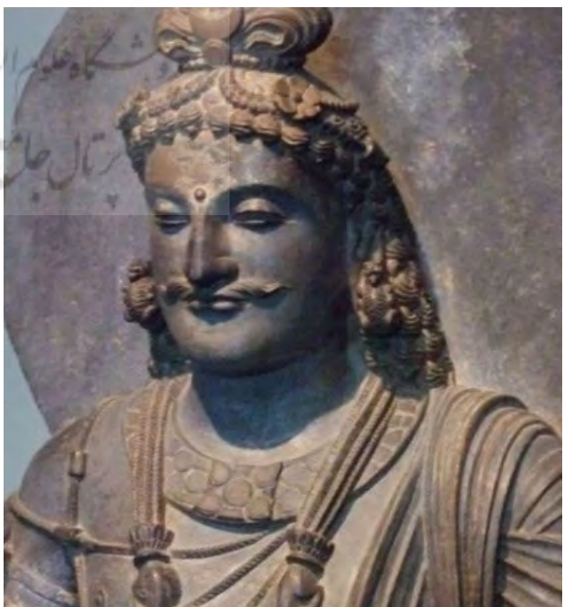
تصویر ۱۵. بودای آینده، قندهار، موزه گیمة فرانسه.