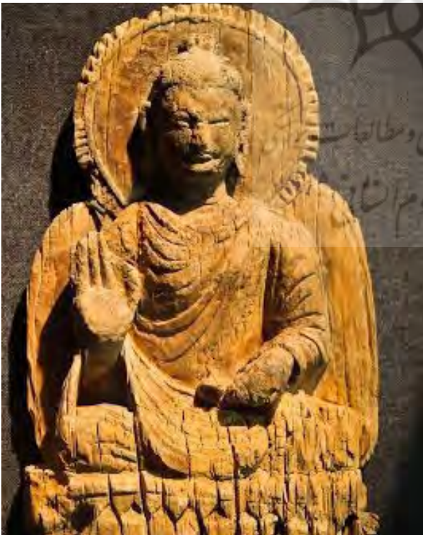
تصوير ۴. بودا، مس عينك، افغانستان