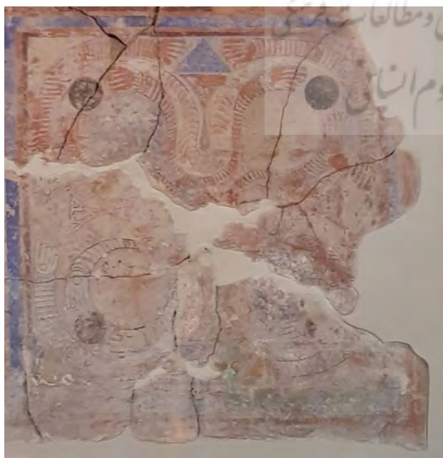
تصویر ۱. قطعه نقاشی شده حفریات نیشابور.

اولین نمونه، نقش‌مایه‌ای است که از حفریات تپه مدرسه به‌دست آمده است (تصویر ۱). طرح خطی این نقش را ویلکینسن در کتابش آورده است (تصویر ۲). همان‌طور که مشاهده می‌شود، دست‌ها برجسته‌ترین عناصر این نقش متقارن به حساب می‌آید. از دیگر عناصر مهم این