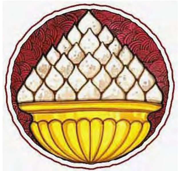
تصویر ۷. سمبل موداکا. مأخذ: Editors of Hinduism Today Magazine, 2007, 99.

از جمله آب‌های ابتدایی آفرینش، روح پر از عشق و دلسوزی، فراوانی و مهمان‌نوازی است. نارگیل نمادی از سر خداست و چشم نمادی از چشم ویشنو. کالاش در کلیه آیین‌های مهم هندو و جین وجود دارد و پایه و