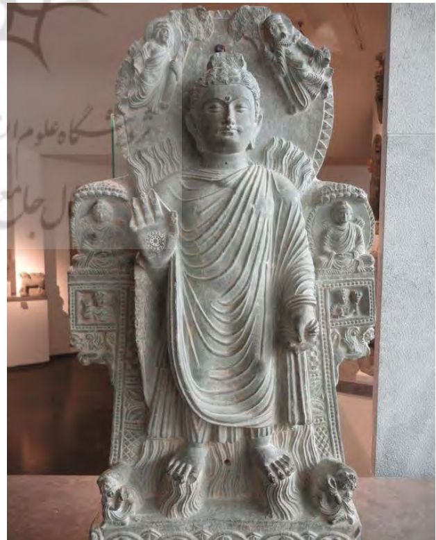
تصوير ۳. بوداي معجزه بزرگ، مكتب قندهار، مأخذ: موزه گيمه www.guimet.fr.