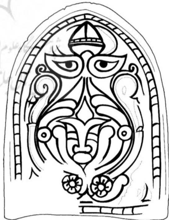
تصویر ۱۱. طرح خطی از مقرنس، سبزپوشان، نیشابور، موزه ایران باستان. مأخذ: Wilkinson, 1987, 254.