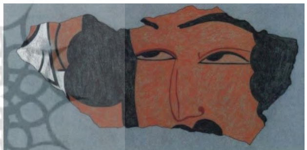
تصویر ۱۴. چهره مرد، گچ نقاشی شده، قنات تپه، نیشابور.