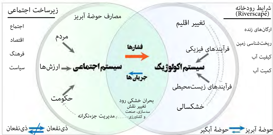
تصویر ۸. زاینده رود؛ سیستم اجتماعی-اکولوژیک تحت چالش در شرایط عدم تعادل سیستمی و نقض روابط درونی.

هر دو وجه اکولوژیک و اجتماعی در مرحله تحلیل از مسیر معمول پژوهش‌های اجتماعی بهره برده شده است و وجه اکولوژیک را به عنوان نیروهای اصلی خارج از ساختار رودخانه شهری مورد تحلیل قرار داده است.