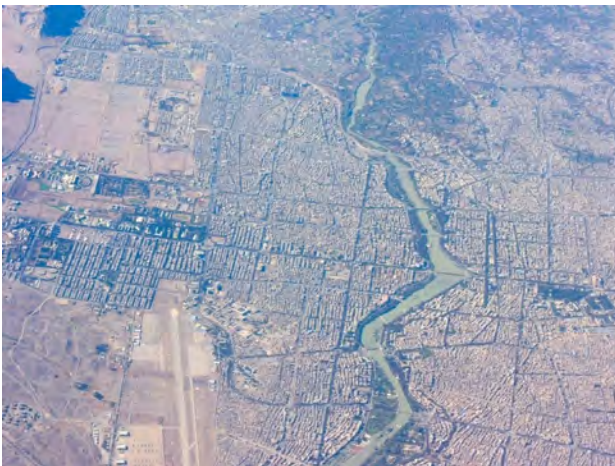
تصویر ۲. عکس هوایی رودخانه زاینده‌رود در حدفاصل مرز جغرافیایی شهر اصفهان.

حضور بازیگران و عوامل مختلف و متعدد در پدید آمدن وضعیت نامطلوب رودخانه زاینده‌رود از یک سو و تعدد و تنوع بحران‌های متعاقب آن؛ فرآیند فهم و بیان مسئله بحران رودخانه زاینده‌رود را به این نقطه رهنمون می‌سازد که: مسئله خشکی رودخانه زاینده‌رود به عنوان مسئله‌ای که از حاصل جمع غیر جبری چندین عامل پدید آمده است، می‌بایست در فرآیند توصیف علی وضع موجود به عوامل سازنده تفکیک و به مثابه ارکان یک بحران چندوجهی تحلیل شوند. عواملی که برخی با بروز دیگری نمود عینی یافته‌اند و برخی مستقیماً ناشی از تصمیمات بخشی و جزءنگرانه مدیریتی بوده‌اند: