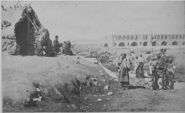
تصویر ۳. خشکسالی اصفهان در عهد ناصر.

مدیریت شهری در مورد محدوده رودخانه در داخل شهرها- تفکیک شد. این عوامل در کنار برداشت مکرر آب بدون پیش‌بینی منابع در نقاط مختلف (علی محمدی، ۱۳۹۳، ۴ و ۵) مجموعه عواملی هستند که بیانگر مدیریت لجام گسیخته آب در این پهنه هستند. مصارف فعلی آب در حوضه آبریز زاینده‌رود در سه بخش عمده کشاورزی، شهری و صنعتی انجام می‌گیرد، که پس از مصرف، مقداری از آنها به صورت زه‌کشی از اراضی کشاورزی مجاور رودخانه و یا پساب‌های شهری و صنعتی مجدداً به منابع آب زیرزمینی یا رودخانه زاینده‌رود بازمی‌گردد (صفوی و راست‌قلم، ۱۳۹۵، ۱۳).