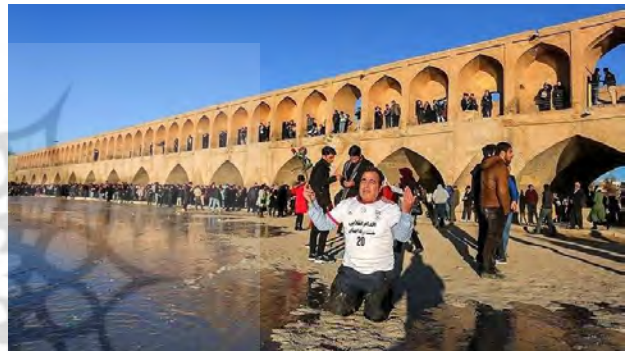
تصویر ۴. استقبال مردم از بازگشایی مجدد رودخانه زاینده رود.

دسته سوم عمدتاً پژوهش‌هایی هستند که با تأکید بر لزوم نگاه