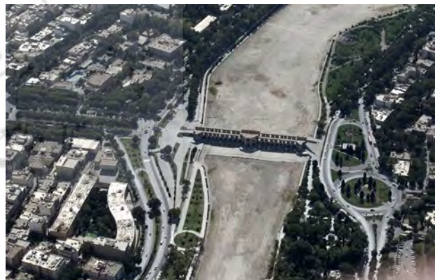
تصویر ۶. خشکسالی، تعریض و پارکسازی حاشیه رودخانه - مأخذ: پایگاه خبری معاون اول ریاست جمهوری، ۱۳۹۳.

بعد اکولوژیکی را به این دیدگاه افزودند و مفهومی از سیستم‌های اجتماعی-اکولوژیکی را شکل دادند. مفهومی که به طور ضمنی نشان می‌دهد که رابطه بین آنها پیچیده‌تر از بهره‌برداری ساده از منابع زمین است (Lansing & Devet, 2018,4). در واقع می‌توان گفت: هیچ سیستم اجتماعی بدون طبیعت وجود ندارد،