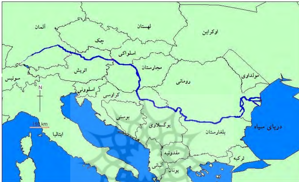
شکل (۲). موقعیت رودخانه دانوب در قاره اروپا

است (ووکوویچ، ۲۰۱۴: ۳۲۵). از سویی بهبود وضعیت کانال کشتیرانی دانوب که امروزه به وسیله کانال به «ماین» و از آنجا به «راین» می‌پیوندد به این رود اجازه می‌دهد که به شاهره کشتیرانی مهمی تبدیل شود که دریای شمال را به دریای سیاه متصل می‌کند (محمدعلی پور، ۱۳۹۴: ۱). شکل (۲).