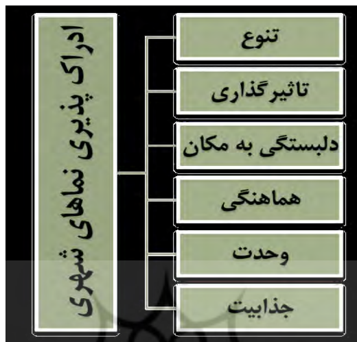
شکل (۴): مولفه‌های موثر در ادراک‌پذیری نماهای شهری

۱۵ خرداد نیستند و اینکه مولفه عدم آسایش در نظر مردم، مانعی موثر در ادراک‌پذیری نما سنجیده شده است، توجه به عوامل اغتشاش و شلوغی و عدم ساماندهی کاربری‌ها در بازار حائز اهمیت می‌باشد.