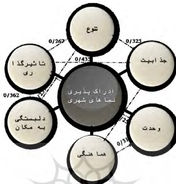
شکل (۳): بررسی رابطه همبستگی بین مولفه‌های ادراک پذیری با یکدیگر

مبتنی بر یافته‌های به دست آمده، جدول (۵) بیانگر پیشنهاد‌های طراحی مولفه‌های ادراک‌پذیری نماهای شهری می‌باشد.