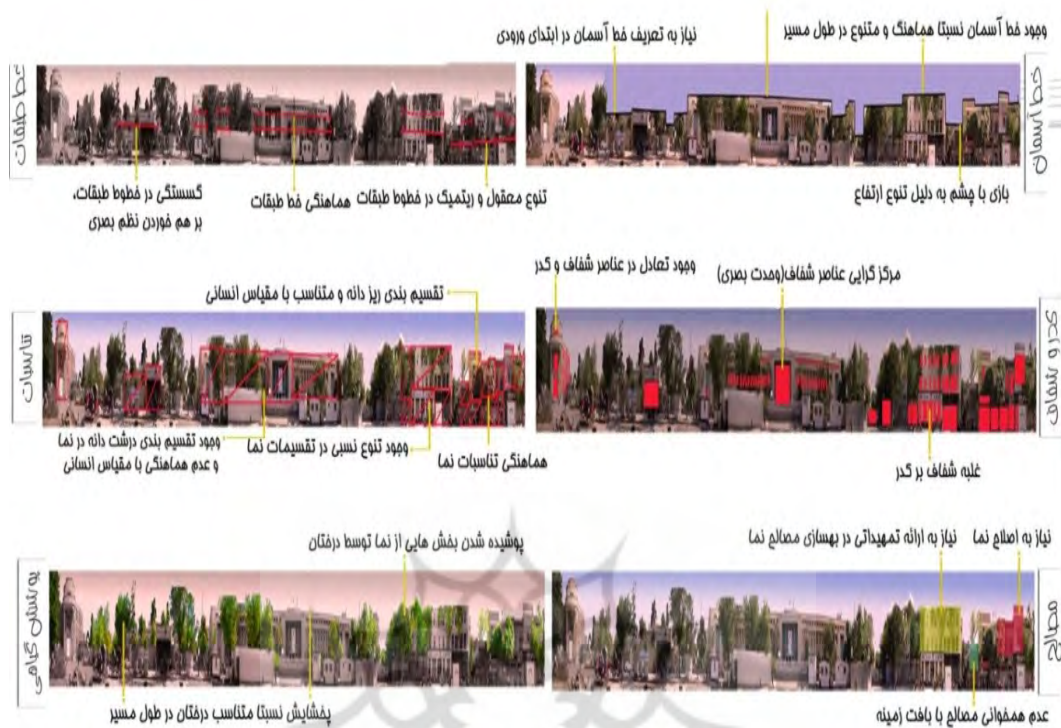
شکل (۲): تحلیل نمای ۱۵ خرداد