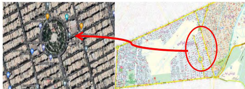
شکل ۳- نقشه موقعیت مکانی میدان در منطقه ۱۳ تهران