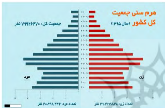
شکل ۱- نمودار هرم سنی سال ۱۳۹۵

با توجه به افزایش روز افزون سالخوردگان کشور طراحان باید تمامی تلاش خود را مبتنی بر طراحی فضایی جهت ایجاد حس تعلق بیشتر به مکان برای کاهش صدمات روحی و جسمی که سالمند با ورود به عرصه زمانی سالخوردگی با آن رو به رو هستند را داشته باشند. در این باره فرضیاتی وجود دارد که شامل ۲ بخش می باشد: