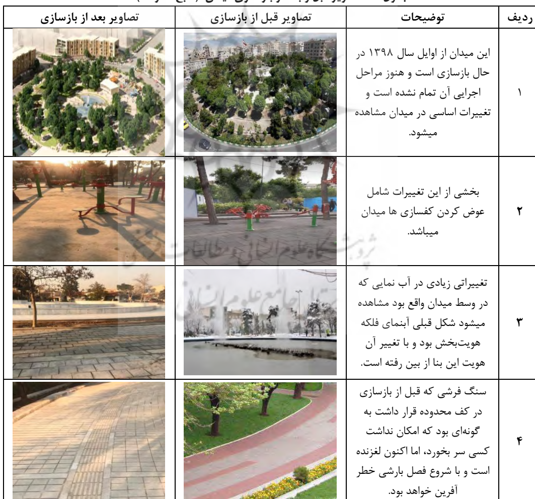
جدول ۴- تصاویر قبل و بعد از بازسازی میدان

جدول ۴ یافته های پژوهش را به صورت خلاصه انجام می دهد: