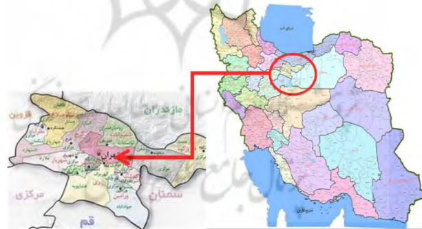
شکل ۲- موقعیت تهران در ایران

فلکه دوم نیروهوایی جزء یکی از بزرگترین میدان های منطقه ۱۳ تهران محسوب میشود قدمت آن به سال ۱۳۴۶ بازمیگردد و جزو میراث تاریخی و فرهنگی محله پیروزی محسوب می شود و بزرگترین آبنمای منطقه ۱۳ هم در این فلکه قرار دارد. این فلکه فضای سبز ۲ هکتاری دارد که در این فلکه باعث سرسبزی محیط شده است که باعث شده محلی برای گردهم آوری قشر های سنی مختلف شود. اهالی به این فلکه تعلق خاطر دارند و همواره محل تجمع آنهاست.