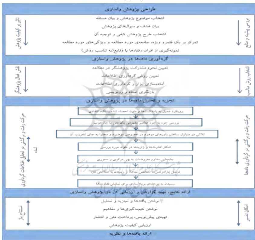
شکل ۲: مراحل انجام پژوهش و اسازی (خنیفر و مسلمی، ۱۳۹۶، ص ۳۹۲)