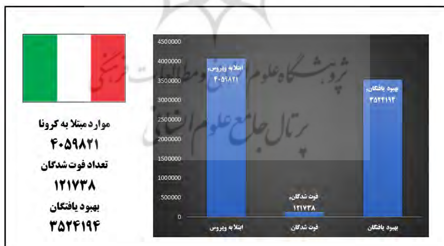
شکل ۳: وضعیت شیوع کروناویروس در کشور ایتالیا (از ۳۰ دسامبر ۲۰۱۹ الی ۳۰ آوریل ۲۰۲۱)

در حالی که ویروس کرونا در آن سوی آتلانتیک روزانه بیش از هزار قربانی می‌گرفت، کشورهای اروپایی و در راس آن‌ها ایتالیا در تدارک خروج از محدودیت‌های ناشی از قرنطینه عمومی بودند. ایتالیا، نخستین کشور اروپایی که در پی شیوع گسترده بیماری کووید ۱۹ شهروندان خود را در قرنطینه قرار