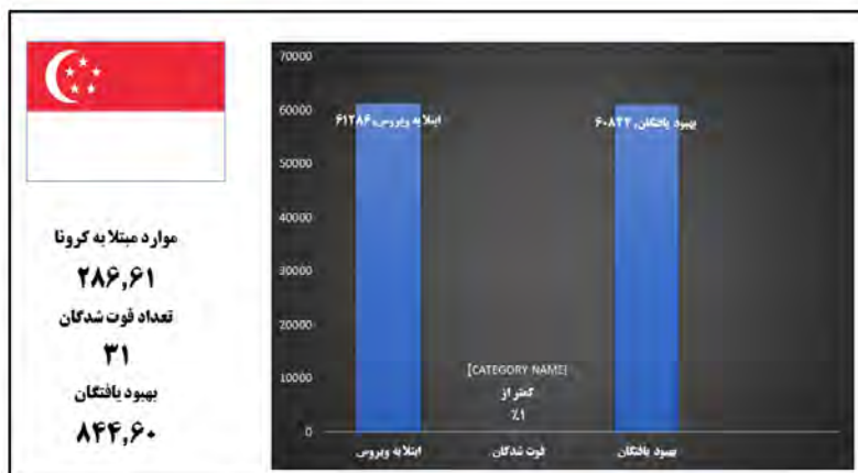
شکل ۲: وضعیت شیوع کروناویروس در کشور سنگاپور (از ۳۰ دسامبر ۲۰۱۹ الی ۳۰ آوریل ۲۰۲۱)

سنگاپور تقریباً همه کارها را درست انجام داد؛ تمام راهبردها و قوانین از ۲۳ ژانویه (تاریخ اولین ثبت رسمی فرد مبتلا به کرونا) از همان موقع انجام و تا به امروز نیز ادامه دارد. در این کشور تعداد تلفات زیر ۵۰ نفر است و این یک آمار حیرت انگیز است. پس از ثبت اولین مورد ویروس کرونا در این کشور، دولت با دقت تمام ارتباطات هر بیمار آلوده را ردیابی می‌کرد. مرزها به