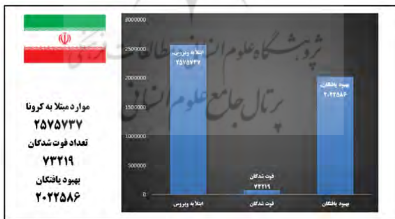
شکل ۵: وضعیت شیوع کروناویروس در کشور ایران (از ۳۰ دسامبر ۲۰۱۹ الی ۳۰ آوریل ۲۰۲۱)

۱۲ مارس ۲۰۲۰ تیمی از متخصصان سازمان بهداشت جهانی (WHO)، شرکای GOARN، موسسه رابرت کوچ در برلین و مرکز کنترل بیماری های چینی در ۱۰ مارس ۲۰۲۰ قرارداد