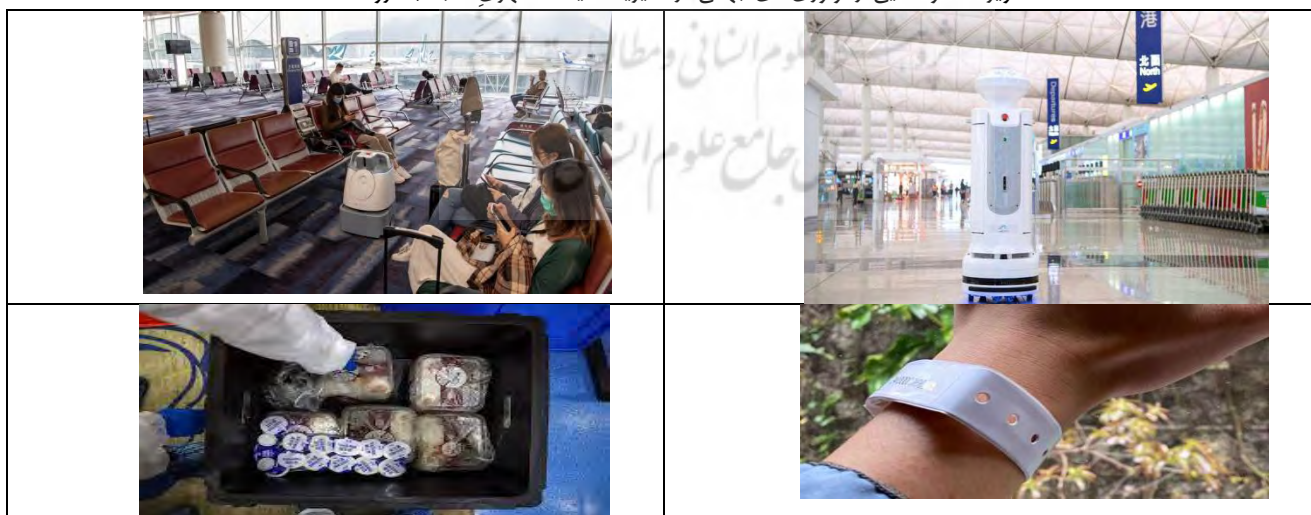
تصویر ۱: نمونه‌هایی از نوآوری‌های جهانی در مدیریت/سیاست شهری مقابله با کرونا

جلوگیری از شیوع ویروس کرونا به شدت با مدیریت/سیاست شهری صحیح و مناسب و همچنین همراهی و همدلی مردم و