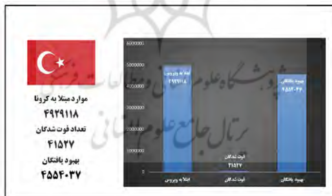
شکل ۴: وضعیت شیوع کرونا ویروس در کشور ترکیه (از ۳۰ دسامبر ۲۰۱۹ الی ۳۰ آوریل ۲۰۲۱)

در اوایل ژانویه، ابتدا کمیته علمی تحولات مربوط به شیوع ویروس در کشور ترکیه تشکیل شد و بالاترین ظرفیت بستر ICU نسبت به اکثر کشورهای اروپایی، چین و ایالات متحده آماده گردید. در موج دوم شیوع ویروس، اولین اقدام دولت در