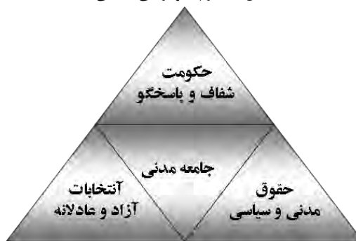
شکل ۱: هرم دموکراسی سیاسی

وابستگی بین دولت و مردم معرف رابطه بین آنها است. قلب نظریه کوانتومی و نظریه عمومی سیستم‌ها این انگاره نهفته است که اساس هستنی بر روابط استوار است. به سخن دیگر، اگر روابط بین کوچک‌ترین ذرات هستی را حذف کنیم، هستی قابل تصور نیست. تمام اجزای یک سیستم با یکدیگر در تعامل هستند تا الگوهایی را شکل دهند و خود سیستم نیز با این الگوها تعریف می‌شود [۱۸]. تعمیم این سخن به نهاد دولت آن است که اولاً سازمان دولت بدون وجود رابطه بین مردم و حکومت قابل تصور نیست. ثانیاً با تغییر نوع رابطه بین دولت و مردم می‌توان الگوی