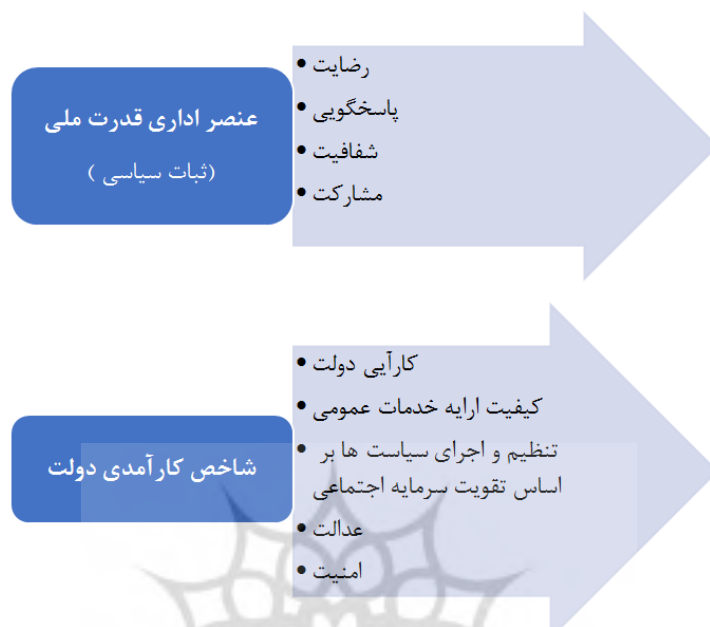
شکل ۴: مدل مفهومی پژوهش

۶- Walonick D.S. (1998). New Science as a Model for Organizational Development, available at http://www.survey-software-solutions.com/readings.htm .