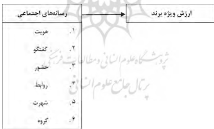
شکل شماره ۱: مدل مفهومی تحقیق.

اجتماعی و همچنین با فراگیر کردن فعالیت های برند خود در رسانه های اجتماعی پاسخ های مشتریان به این فعالیت ها را مشاهده نموده و با استفاده از این سازوکارها، وفاداری مشتریان به برند خود را تقویت نموده و پاسخ مشتریان در جهت افزایش رضایت از برند را دریافت نمایند. جامعه آماری پژوهش کاربران رسانه اجتماعی اینستاگرام چرم درسا هستند. با جمع‌بندی پیشینه پژوهش می توان دریافت که اگرچه به صورت ارتباط دوگانه متغیرهای رسانه اجتماعی و برند مطالعه شده‌اند، با این وجود با بررسی‌هایی که محقق انجام داده است به چنین پژوهشی دست نیافتیم. مدل مفهومی این پژوهش با استناد به پیشینه‌ی نظری و تجربی، از ترکیبی از مدل‌های کندوی عسل اسمیت ۱ (۲۰۰۷) و مدل ارزش ویژه برند آکر ۲ (۱۹۹۱) بهره گرفته شده است. دلیل استفاده از این مدل‌ها، دارا بودن طیف وسیعی از متغیرهای رسانه‌های اجتماعی و برند است که نسبت به سایر مدل‌های پیشینه تحقیق، به موضوع مورد بررسی، کامل‌تر و نزدیک‌تر بوده و از اعتبار بالاتری برخوردار می‌باشد. از این رو بر اساس آنچه که بیان گردید، الگوی مفهومی و نظری ارتباط بین متغیرهای رسانه اجتماعی و برند در شکل ۱ آمده است. هدف پژوهش حاضر، بررسی تاثیر رسانه‌های اجتماعی بر ارزش ویژه برند در مدارس ابتدایی شهر اصفهان می‌باشد.