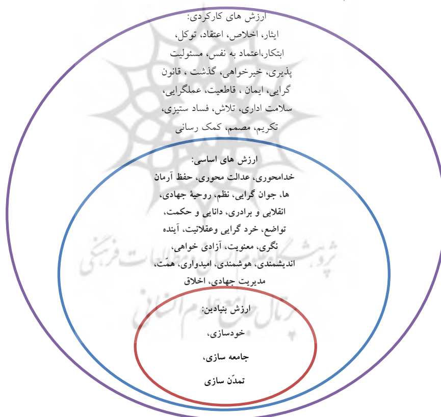
نمودار ۲- شبکه مقولات استخراج شده

در کدگذاری محوری ارتباط مقولات و مفاهیم با یکدیگر مورد بحث و بررسی قرار می گیرد. در یک بررسی مقایسه ای این مقولات در سه طبقه جای می گیرند؛ که عبارت اند از: ارزش های بنیادین، ارزش های اساسی و ارزش های کارکردی. روابط این ارزش ها به صورت یک فرآیند قیاسی طی می شود؛ به طوری که ارزش های کارکردی ذیل ارزش های اساسی تعریف می شود و ارزش های اساسی نیز به مراتب ذیل، ارزش بنیادین معنا و مفهوم پیدا می کنند.