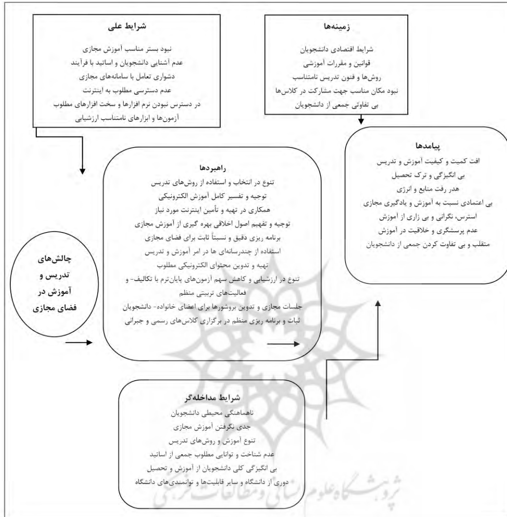
نمودار (۱): مهم‌ترین چالش‌های پیش‌روی تدریس در شاخص‌های آموزشی

همان‌طور که در مدل مورد نظر مشاهده می‌شود، نتایج تحلیلی مصاحبه‌ها نشان داد که علت‌های بسیاری در کنار زمینه‌های به وجودآورنده در چالش‌های مورد نظر تاثیر گذار بوده‌اند که هر یک از آن‌ها به صورت موردی بیان شده است. برای نمونه نبود بستر مناسب برای آموزش مجازی و همچنین عدم آشنایی کامل دانشجویان و اساتید به ویژه در ابتدا باعث مشکلات بسیاری بوده است. موارد مورد