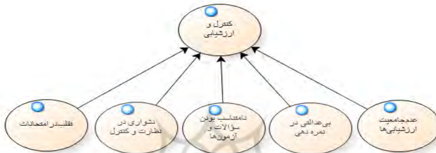
نمودار (۳). چالش های کنترل و ارزشیابی در فرآیند تدریس

نمودار شماره ۳. خروجی داده های پژوهش در رابطه با ارزشیابی و شرایط آن در این پژوهش را نشان می دهد. همانطور که مشاهده می شود موارد بسیاری چون تقلب در امتحانات، نامتناسب بودن سؤالات و آزمون ها، بی عدالتی در نمره دهی، عدم جامعیت ارزشیابی ها و دشواری در نظارت و کنترل بیش ترین میزان استناد را در کدهای باز این پژوهش داشته و نشان دهنده ی وجود مشکلات جدی در فرآیند کنترل و ارزشیابی در این نوع از تدریس داشته اند.