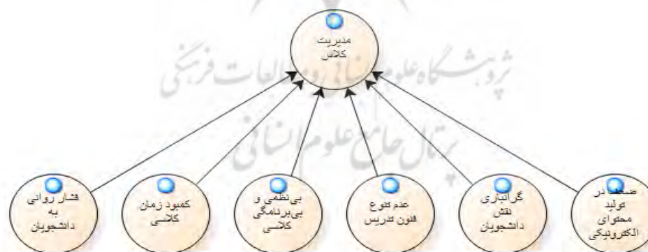
نمودار (۲). چالش‌ها و مشکلات مدیریت کلاس درس در فرآیند تدریس

نمودار شماره ۲. بحث از مدیریت کلاس درس دارد و چالش‌هایی که معلمان در کلاس درس در شرایط کلاس‌های مجازی دارند. موارد مورد نظر شامل کمبود زمان کلاسی، عدم تنوع فنون تدریس، ضعف در تولید محتوای الکترونیکی، بی‌نظمی و بی‌برنامگی کلاسی، فشار روانی به دانشجویان، گرانباری نقش دانشجویان است.