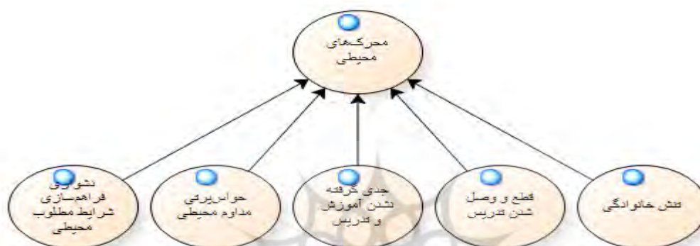
نمودار(۵). چالش‌های محیطی در فرآیند تدریس

نمودار ۵. در نهایت چالش‌ها و مشکلات مربوط به محرک‌های محیطی را نشان می‌دهد. بر این اساس خروجی تحلیل داده‌های پژوهش نشان از مواردی چون دشواری فراهم‌سازی شرایط مطلوب محیطی، جدی گرفته نشدن آموزش و تدریس، حواس‌پرتی مداوم محیطی، قطع و وصل شدن تدریس و تنش خانوادگی بین افراد را به عنوان مهم‌ترین این عوامل دارد.