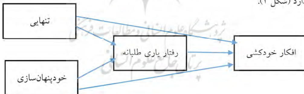
شکل ۱: مدل مفهومی پژوهش

بر اساس آنچه مطرح شد، به نظر می‌رسد عواملی مانند تنهایی، خودپنهان‌سازی و رفتارهای یاری طلبانه با افکار خودکشی مرتبط باشند؛ لذا فرضیه اصلی پژوهش حاضر عبارت است از اینکه رفتار یاری طلبانه بین ارتباط خودپنهان‌سازی و تنهایی با افکار خودکشی نقش میانجی دارد (شکل ۱).