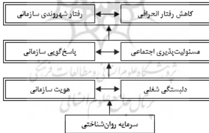
شکل ۲. مدل ساختاری تفسیری پیامدهای سرمایه روان‌شناختی کارکنان

پس از مشخص شدن سطوح هر یک از پیامدها و همچنین در نظر گرفتن ماتریس خودتعاملی ساختاری، مدل ساختاری تفسیری ترسیم شد. مدل نهایی در شکل (۲) نشان داده شده است.