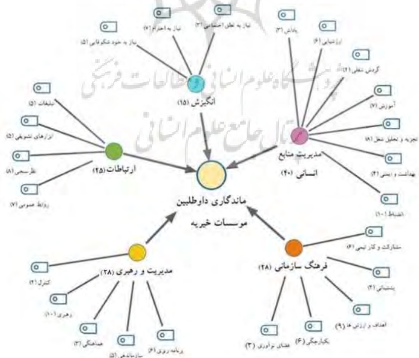
شکل ۳. شبکه مضامین و ارتباط دهی تم‌ها با یکدیگر و اهمیت آنان از دید داوطلبان نسل میانسال