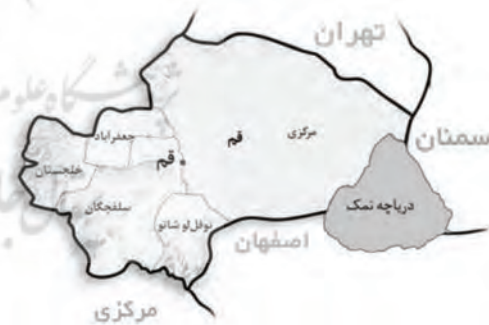
شکل ۲: محل دریاچه نمک قم در نقشه

بر این اساس، مناطق کویری نمکی مناطقی بکر و شناخته‌نشده به‌شمار می‌روند که با دارا بودن بلورها و دریاچه نمکی مقصدی جذاب و متفاوت را برای گردشگران کویری تداعی می‌کنند. دریاچه نمک قم نمونه‌ای از این مناطق بکر و دیدنی است که در حد واصل سه استان قم، اصفهان و سمنان قرار دارد و دارای وسعت بسیار زیادی است. دریاچه نمک، به‌طور متوسط، دارای فاصله‌ای در حدود ۶۰ کیلومتر از شهر قم در جناح شرقی است. شکل ۲ مکان دریاچه را در نقشه نشان می‌دهد.