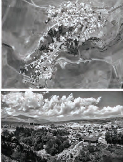
شکل ۲: روستای بیلهدرق

نمونه مورد مطالعه روستای بیلهدرق در استان اردبیل، واقع در سه کیلومتری شمال شهرستان سرعین، از توابع دهستان آبگرم و دومین قطب گردشگری شهر سرعین است. از عوامل مؤثر بر انتخاب این روستا می توان به ویژگی های طبیعی مانند آب درمانی، مناظر طبیعی و بکر، هوای خنک تاپستانی، آب معدنی گازدار و آبشارهایی در طول مسیر رودخانه و غارهای بزرگ و کوچک تاریخی اطراف روستا اشاره کرد.