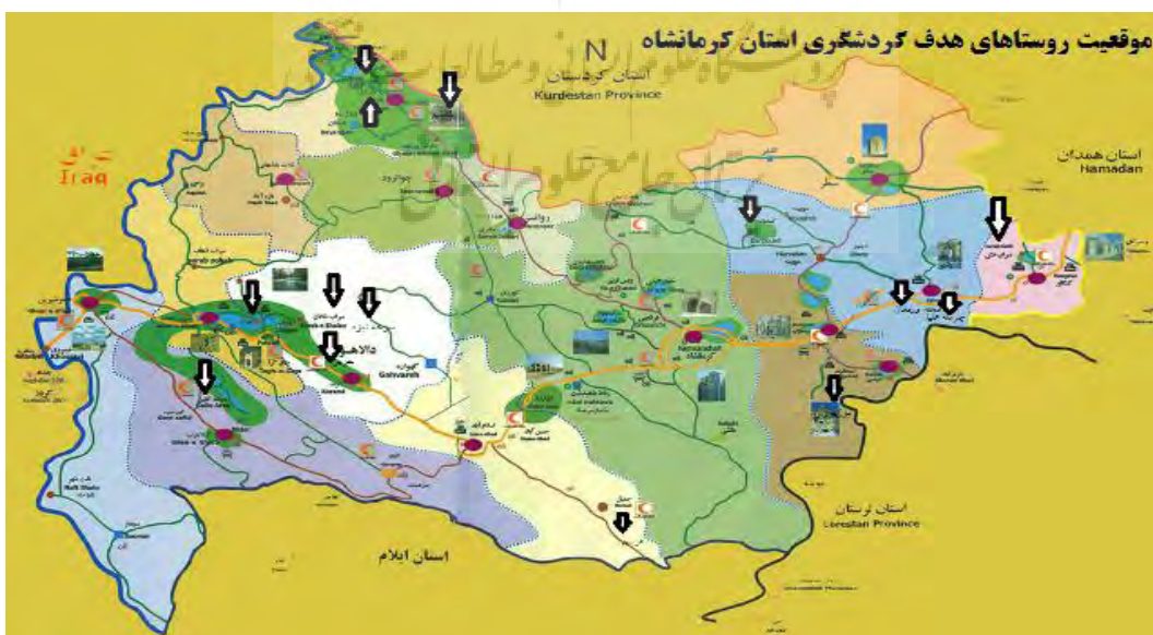
شکل ۲: نقشه استان کرمانشاه و روستاهای هدف گردشگری