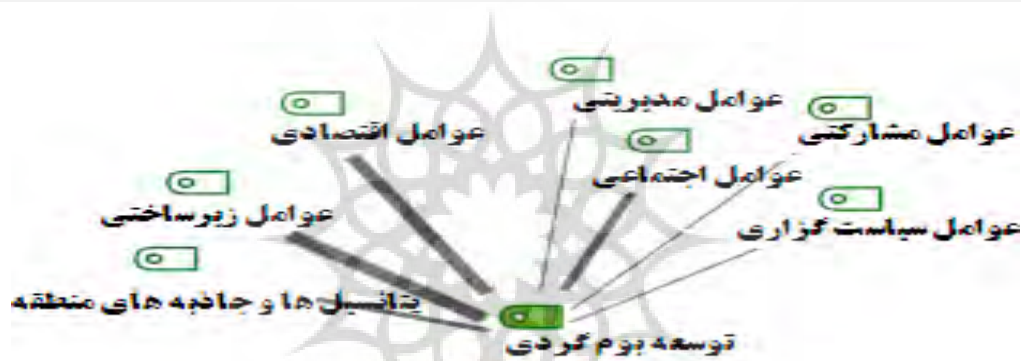
شکل ۱: مدل مفهومی پژوهش با نرم افزار maxqda12