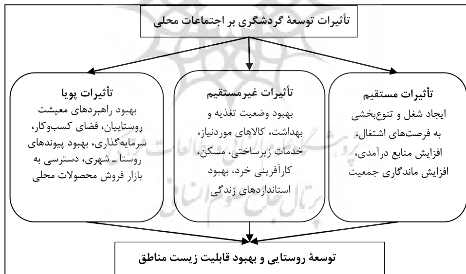
شکل ۲: مدل مفهومی پژوهش

هرگونه توسعه‌ای، از جمله توسعه گردشگری، آثار متفاوتی بر ساکنان محلی آن منطقه برجای می‌گذارد. بررسی دیدگاه‌های گوناگون بیانگر تأثیر گردشگری در توسعه اجتماعات محلی در سه بعد اساسی به شرح زیر است: الف) تأثیر مستقیم از طریق ایجاد شغل و درآمد؛ ب) تأثیر غیرمستقیم از طریق بهبود وضعیت تغذیه، بهداشت، کالاهای موردنیاز، خدمات زیرساختی، مسکن و... که به ارتقای آثار بین‌بخشی و توسعه سایر بخش‌ها منجر می‌شود؛ ج) تأثیرات پویا از طریق بهبود راهبردهای معیشت خانوارها، فضای کسب‌وکار و سرمایه‌گذاری، دسترسی به بازار فروش محصولات محلی و مانند آن (شکل ۲).