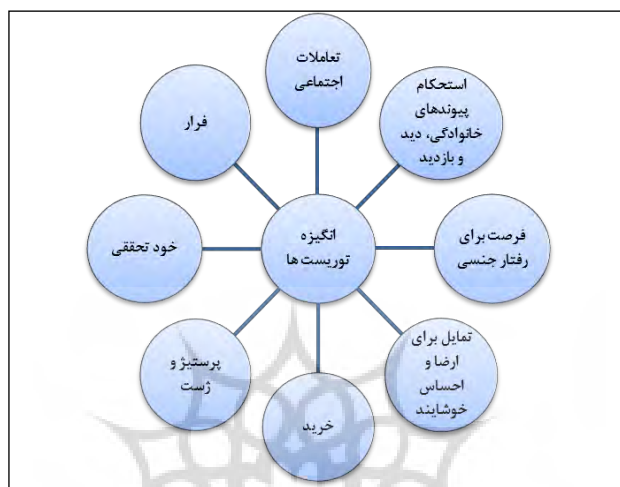
شکل ۱: عوامل روان‌شناختی گردشگران برای مسافرت (کلانتری و فرهادی، ۱۳۸۷: ۱۷۱)

تحت عنوان طبیعت‌گردان موردی از آن‌ها یاد می‌کند، تجربه سبک زندگی جدید و متفاوت مهم‌ترین انگیزه گردشگران است. همچنین کشف مناطق و کسب آگاهی، افزایش دانش و ملاقات با مردم جدید را از دیگر انگیزه‌های مهم آنان برمی‌شمرد (سید موسوی، ۱۳۹۲: ۱۲۴). برن ۱ انگیزه گردشگران نوین را ناشی از شرایط پست‌مدرن (پسانوگرا) می‌داند و سایر عوامل را ذیل مؤلفه‌های روان‌شناختی جای داده است. وی به نقل از ریان عوامل روان‌شناختی گردشگران را در شکل ۱ نمایش می‌دهد.