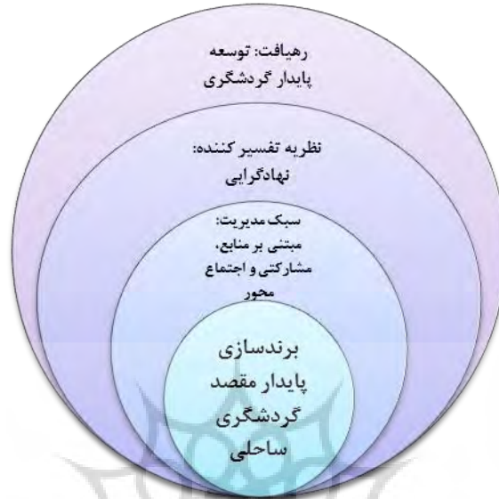
شکل ۱: چارچوب نظری پژوهش

در این پژوهش، برای تبیین مفاهیم نظری، ابتدا شاخص‌ها در منابع مرتبط با مباحث برند مطالعه شد و شاخص‌های مورد استفاده سایر محققان استخراج شد که در جدول ۱ آورده شده است. در گام بعدی، مدل بین‌المللی بررسی شده که یافته‌های موجود حاکی از این است که عمده مدل‌ها به‌طور عمومی طراحی و اجرا شده است. بخش‌های عمومی مشترک بین کالا و خدمات از مدل‌های مذکور استخراج شده و در تلفیق با مدل‌های اختصاصی مکان یا مقاصد، با توجه به چارچوب تحقیق، نقد شده و بخش‌هایی از مدل‌ها مورد استفاده قرار گرفته است. همچنین ۱۷ مدل اختصاصی مقصد گردشگری نیز نقد شده و فراوانی شاخص‌های مورد استناد در آن‌ها استخراج شده است. یافته‌ها حاکی از این است که در این منابع عموماً ادراک یا نگرش مخاطب از مقصد در گرو آگاهی از برند بوده و موفقیت برند به‌طور نسبی در ارتباط با تصویر ذهنی برند ذکر شده است. در نهایت، از برخی شاخص‌های چهار مدل «ارزش ویژه برند (آکر، ۱۹۹۹)»، «برنامه‌ریزی برند (کوین کالر، ۲۰۰۸)»، «معماری برند (کلوردن و فابرسیوس، ۲۰۰۶ و بیکر ۲۰۰۸)» و «مدل ذی‌نفعان مقصد (بورن هورست، ریچی و شیپان ۲۰۱۰)» استفاده شده (شکل ۲) تا بتوان با ترکیب و سنجش آن‌ها، از طریق مؤلفه‌های عینی و ذهنی، به ترسیم شاخص‌های اندازه‌گیری برند پایدار در منطقه مورد مطالعه دست یافت. ذی‌نفعان در این پژوهش، چهار گروه «جامعه محلی»، «صاحبان کسب‌وکار»، «مدیران» و «گردشگران» در نظر گرفته شده‌اند.