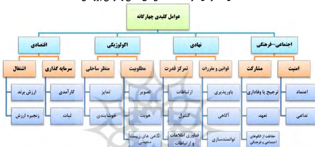
شکل ۴: عوامل، مؤلفه‌ها، شاخص‌های اصلی و فرعی پژوهش

گام نهم: آزمون شاخص‌ها با استناد به تجارب جهانی و خبرگان داخلی غربالگری اولیه به منظور شناسایی شاخص‌های کلیدی انجام گرفت و فهرستی از ادبیات سازه‌های تبیین‌کننده برند در مقاصد گردشگری تدوین شد. بررسی سازه‌ها و طبقه‌بندی و ترکیب کارهای صورت گرفته به طور کلی شانزده سازه اولیه را نشان می‌دهد که برندسازی پایدار مقصد گردشگری ساحلی چابهار با آن‌ها قابلیت طراحی پیدا می‌کند. چهار سازه نیز از تجربیات خبرگان و سایر متون استخراج و به شاخص‌های پیشین اضافه شده که در قالب شکل ۴ آورده شده است.