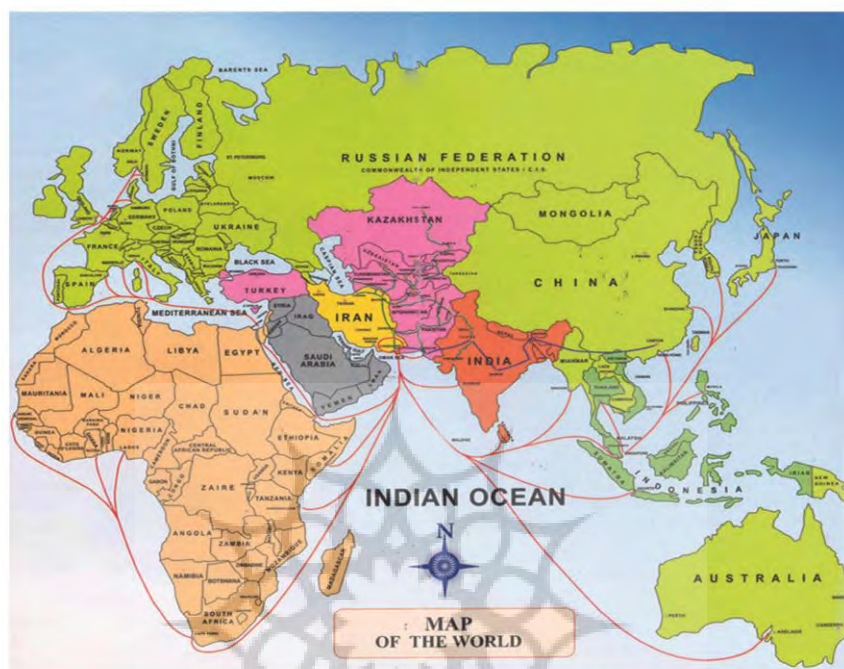
نقشه ۱: اهمیت کریدوری موقعیت چابهار در جهان

جنوب شرق کشور به‌شمار می‌رود (رکن‌الدین افتخاری، پرچکانی، ۱۳۹۵). این موارد، به‌علاوه ارزش‌های کریدوری بین‌المللی، ژئوپولیتیکی، ژئواکونومیکی این منطقه در جهان، باعث شده تا سواحل منطقه چابهار پایلوت اصلی (جامعه نمونه) مطالعات این پژوهش انتخاب شود (نقشه ۱).