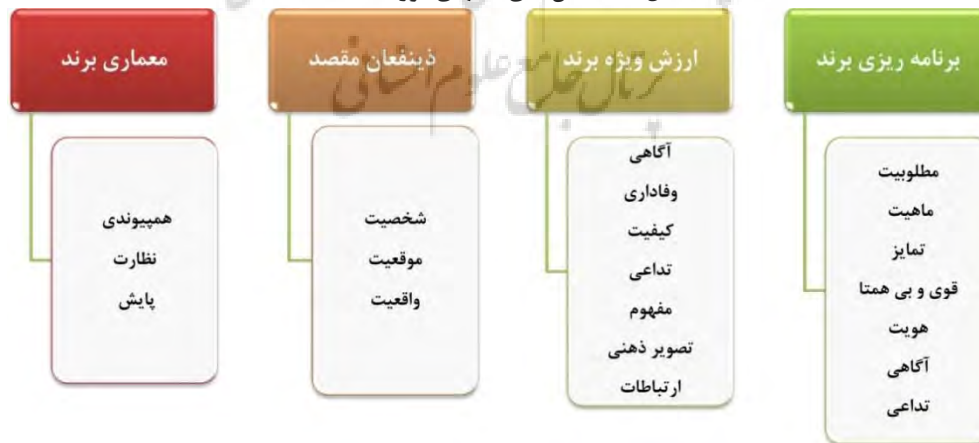
شکل ۲ شاخص‌های مدل‌های مورد استفاده

منبع: آکر (۱۹۹۹)، کلا (۲۰۰۸)، کلوردن و فابریسیوس (۲۰۰۶)، بیکر (۲۰۰۸)، هورست، ریچی و شیهان (۲۰۱۰)