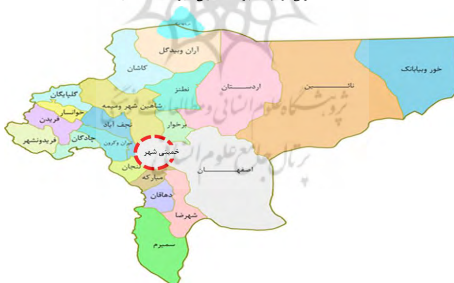
نقشه (۱): معرفی موقعیت شهرستان خمینی شهر در استان اصفهان