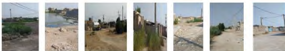
شهرک ولی عصر (گاما) تلمبه خانه شماره ۳ جرف المالح شهرک صباغان (کمپ B) ایستگاه ۷ نيزار دو نيزار یک

شکل ۳- تصویر هفت منطقه حاشیه‌نشین شهر بندر امام خمینی