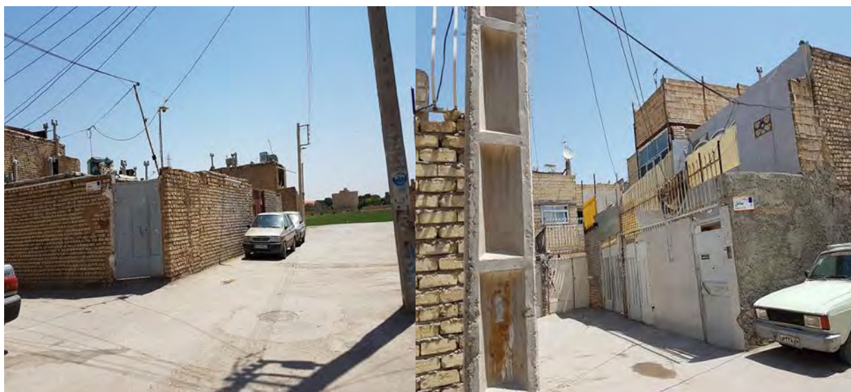
شکل (۲): وضعیت کالبدی مسکن در سکونتگاه های غیر رسمی منطقه ۱۴ اصفهان، مأخذ: برداشت های میدانی پژوهشگران، ۱۳۹۸

جدول (۷): برآورد آزمون t تک نمونه‌ای جهت مقایسه معنی داری هر یک از عوامل در پرسشنامه تاثیر بر کیفیت و رفاه شهروندان بر مبنای زیست پذیری شهری