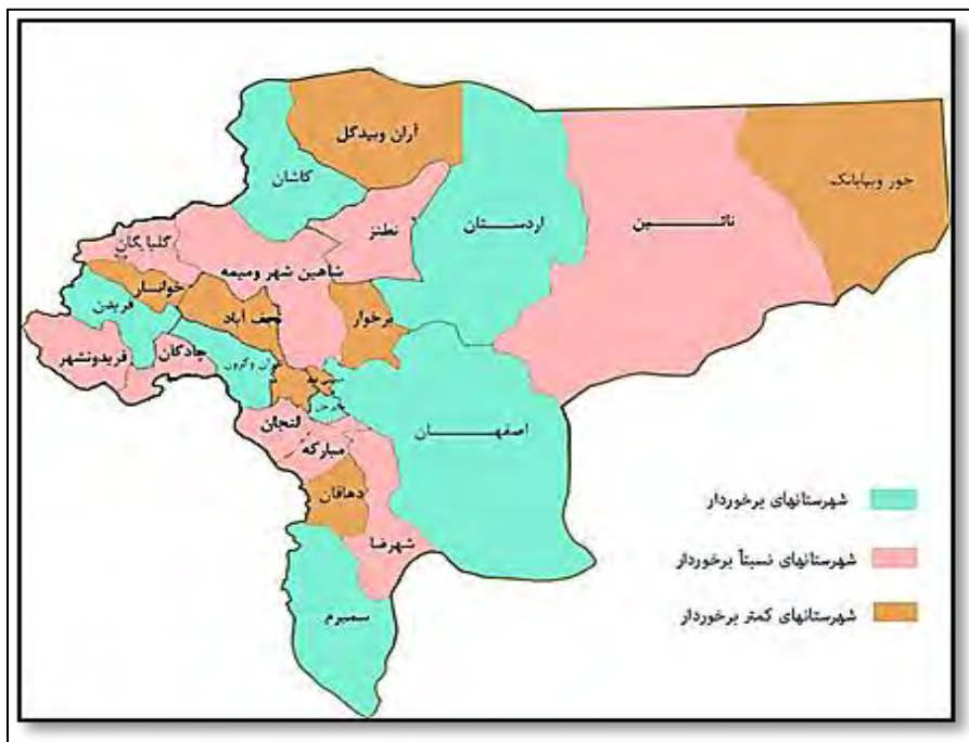
تصویر (۱): سطوح توسعه یافتگی کالبدی سکونتگاه‌های روستایی شهرستانهای استان اصفهان ترسیم: مولفین