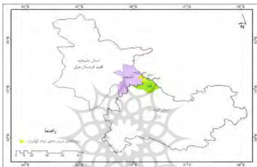
شکل ۱. نقشه منطقه مورد مطالعه (منبع: ترسیم نگارندگان، ۱۳۹۹)

به حدود ۳۰ درجه بالای صفر می‌رسد. بر اساس آخرین سرشماری انجام‌شده در شهرستان، منطقه مورد مطالعه دارای ۶۰۴۳۱ نفر جمعیت است؛ از این تعداد ۳۶.۱۰۳ نفر در نقاط شهری و ۲۴۳۲۸ نفر در نقاط روستایی ساکن بوده‌اند (مرکز آمار ایران، ۱۳۹۵). این شهرستان از غرب به طول ۹۶ کیلومتر با کشور عراق هم‌مرز است. بازارچه مرزی شوشمی در فاصله ۳۵ کیلومتری شهرستان پاوه و ۵ کیلومتری غرب نوسود پاوه و ۱۵۵ کیلومتری کرمانشاه در محوطه‌ای بلند و پلکانی شکل در حدود ۲ هکتار واقع شده است. این بازارچه از سمت عراق به حوزه حلبچه استان سلیمانیه در شمال عراق متصل و در مجاورت شهر تهویل کردستان عراق قرار دارد و این منطقه (نوسود به تهویل) مرکز اصلی تردد کولبران و باربران مرزی است.