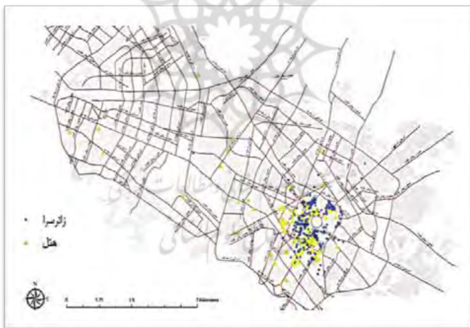
شکل ۳. موقعیت مکانی و نحوه پراکنش زائرسراها و هتل‌های شهر مشهد

نیافته‌اند با تصویب هیئت وزیران از حکم این ماده مستثنا هستند. همان‌طور که ملاحظه می‌شود، این دو تبصره زمینه عدم اجرای قانون و قانون‌گریزی دستگاه‌های اجرایی را از سال ۱۳۸۶ تا کنون فراهم آورده است و همچنان نیز بسیاری از دستگاه‌های دولتی و وزارت‌خانه‌ها و دانشگاه‌ها نه تنها مراکز اقامتی خود را واگذار نکرده‌اند، بلکه به این واحدها در طول ده سال اخیر اضافه نیز کرده‌اند. با اعتراضات فعالان بخش خصوصی گردشگری و نیز سازمان میراث فرهنگی، دیوان عدالت اداری برای تأکید بر ممنوعیت ایجاد و اداره هر گونه واحد اقامتی توسط دستگاه‌ها رأی نهایی خود در راستای اجرای تبصره یک ماده ۲۳ قانون مدیریت مبنی بر ممنوعیت ایجاد و اداره هر گونه واحد اقامتی شامل مهمان‌سرا، زائرسرا، مجتمع مسکونی، رفاهی، واحد درمانی و آموزشی، فضاهای ورزشی، تفریحی، و نظایر آن توسط دستگاه‌های اجرایی را صادر کرد. بنابراین، بار دیگر بر ممنوعیت ایجاد و اداره هر گونه واحد اقامتی توسط دستگاه‌های اجرایی تأکید شد. اما این تأکید و این رأی تا زمانی که نظارت و اقدام جدی برای حذف مهمان‌سراها دولتی نباشد، در حد یک رأی باقی خواهد ماند. از سوی دیگر، باید در نظر گرفت، در ایران، کارمندان ادارات و سازمان‌های دولتی که به سفر می‌روند آمار زیادی را به خود اختصاص می‌دهند. اگر این تعداد افراد در هتل‌ها اقامت کنند، به طور قطع سرمایه‌گذاران صنعت هتل‌داری وضعیت مناسب‌تری خواهند داشت. این در حالی است که اقامتگاه‌های دولتی حتی در ایام نوروز یا تعطیلات نیز پذیرای کارکنان خود هستند و این مصداق بارز دخالت دولتی‌ها در امور بخش خصوصی به‌ویژه صنعت هتل‌داری است؛ صنعتی که سرمایه‌گذارانش همیشه از اینکه هتل‌های آن‌ها خالی از مسافر است شکایت می‌کنند.