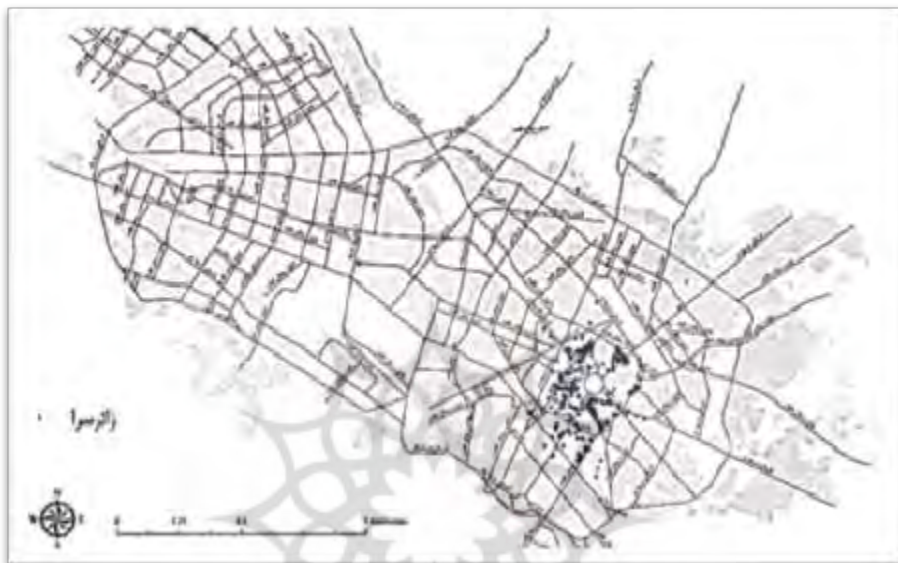
شکل ۲. نحوه پراکنش زائرسراهای اوقافی در سطح شهر مشهد

بر اساس اطلاعات اداره کل اوقاف خراسان رضوی، در حال حاضر تعداد زائرسراهای اوقافی این استان حدوداً ۲۹۵ مورد است. ۱ ملیت بیشتر مراجعه‌کنندگان ایرانی و از شهرهای مختلف ایران است، اما منحصراً زائرسراهایی برای افراد پاکستانی وجود دارد که تعداد آن‌ها اندک است و اداره اوقاف استان نظارت آن‌ها را بر عهده دارد. اسکان در این دسته از زائرسراها عمدتاً به صورت کاروان (گروهی) صورت می‌گیرد. ۸۰ درصد مراجعه‌کنندگان از نظر جنسیت مرد هستند. این زائرسراها فقط پذیرای میهمانان شیعه‌اند و از پذیرفتن افراد اهل تسنن و سایر مذاهب اجتناب می‌ورزند.