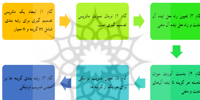
شکل (۳): مراحل انجام روش تاپسیس

در این پژوهش به جهت رتبه‌بندی چالش‌های روابط ژئوپلیتیکی ایران و فرانسه در سه سطح ملی، منطقه‌ای و جهانی از روش تاپسیس استفاده شده که در ادامه نتایج نهایی هر کدام از سه سطح یاد شده تشریح شده است.