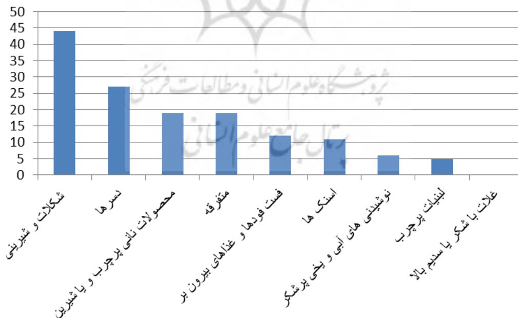
شکل ۱. رتبه بندی محصولات غذایی ناسالم بر حسب تعداد مشاهده

جدول ۴ فراوانی تکنیک‌های پیشبردی به کار رفته در جایگذاری محصولات غذایی ناسالم را نشان می دهد. تکنیک جاذبه‌های هیجانی با ۴۴/۶٪ بالاترین آمار به کارگیری و پس از آن تکنیک جاذبه‌های محصول غذایی با ۲۸/۷٪ و سپس تکنیک عناصر بصری با ۲۷٪ را حاصل کردند. ولی به صورت موردی بالاترین رتبه متعلق به تکنیک جاذبه‌های محصول غذایی؛ دلپذیری با ۱۷/۸٪ بوده است.