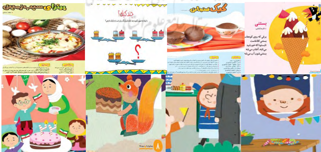
شکل ۱. تعدادی از گزینه‌های نمایش محصول غذایی ناسالم در محتوای مجله

با توجه به اینکه نتایج این بررسی بر اساس تحلیل محتوای مجلات در یک دوره شش ماهه بوده، لذا نقش تغییرات زمانی در جایگذاری گزینه‌های غذایی مشهود نبوده است. لذا توصیه می‌شود محتوای مجلات طی سالهای متوالی و یا متناوب مورد تحلیل و بررسی قرار گیرد. همچنین تحلیل محتوای رسانه‌های جدید نظیر دیوار نویسی و پوسترها که امروزه در کنار رسانه‌های جمعی حضور موثر دارند و همچنین شبکه‌های اجتماعی که امروزه وارد دنیای کودکان نیز شده‌اند، می‌تواند مکمل نتایج این بررسی باشند.