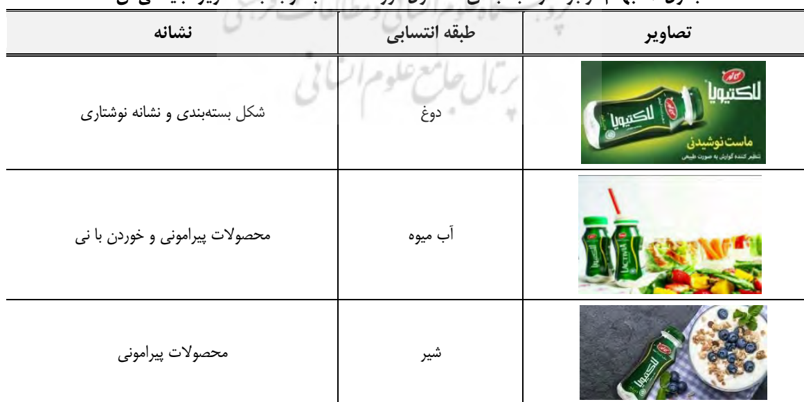
جدول ۲. ابهام موجود در طبقه‌بندی محصول مورد مطالعه با توجه به تصاویر تبلیغاتی آن

جدول ۲، سه نمونه از تصویرهایی را که از این محصول در سایت شرکت کاله وجود دارد، همراه با طبقه انتسابی و نشانه‌ای که به انتساب طبقه منجر شده است، نشان می‌دهد. این طبقه‌بندی و تحلیل مرتبط با آن توسط پژوهشگران مقاله حاضر انجام گرفته است تا ابهام احتمالی موجود در طبقه محصول پیشنهادی و غیر مرتبط بودن برند آن با طبقه را نشان دهد.