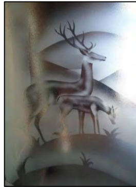
تصویر ۶: تکنیک سایه

روش سایه در میان هنرمندان شیشه‌گر به ندرت شناخته شده است و نتایج بسیار ظریف و زیبایی دارد. همانطور که از نام این تکنیک برمی‌آید پوشش سطح شیشه در این روش بسیار کم است. در تکنیک سایه تمایز بین عناصر به وسیله سند کردن هر عنصر در وسعت و محدوده متفاوت مشخص می‌شود (تصویر ۶). به عبارتی دیگر در این روش هیچ عمقی بر روی شیشه ایجاد نشده و سطح آن مانند روش سندبلاست سطحی به طور کامل مات نمی‌شود بلکه طرح مورد نظر مانند سایه بر روی شیشه مشخص می‌شود (Dobbins, 1998: 96-98).