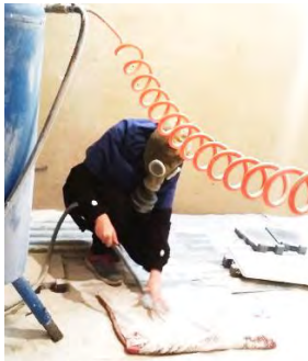
تصویر ۳: انجام سندبلاست

مخصوص بر خوردار است، انجام می‌گیرد. یکی از مزیت‌های اصلی انجام سندبلاست در داخل کابین این است که تمام گرد و غبار حاصل از مواد خروجی، داخل آن احاطه شده و به بیرون از آن اتاقتک نفوذ نمی‌کند و در نتیجه ذرات وارد دهان و ریه نشده و به دستگاه تنفسی آسیب نمی‌رساند.