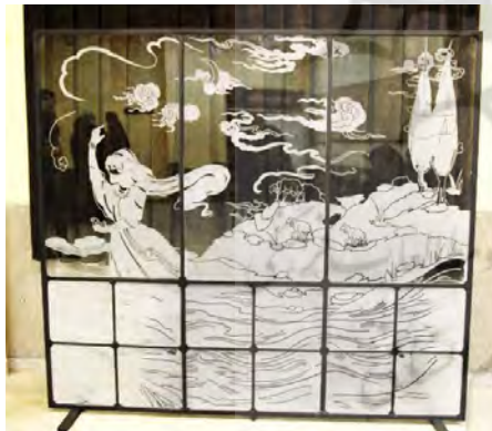
تصویر ۱: نمونه سندبلاست شیشه

سندبلاست به فرآیند مات کردن سطح شیشه با شن و ماسه گفته می‌شود که این شن و ماسه با سرعت بالا توسط جریان هوا به سطح شیشه پاشیده می‌شود. ذرات ترکیبی یا قطعات کوچک پوسته نارگیل نیز گاهی به جای شن و ماسه در سندبلاست کاربرد دارند. لوله‌ای که جریان هوا را انتقال می‌دهد به یک نازل حاوی یک سری حفره‌های ظریف و نازک خاتمه می‌یابد. با عواملی مانند تغییر مقدار شن و ماسه، حجم و سرعت جریان و همچنین قطر شیلنگ، می‌توان اثرات متفاوتی روی شیشه ایجاد کرد.