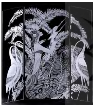
تصویر ۴: سندبلاست سطحی

این نوع سندبلاست اثرگذاری کم‌تری روی شیشه دارد و به سبب پرتاب مواد با حجم و سرعت کم از تفنگی به سطح شیشه، میزان مات کردن سطح شیشه کم و سطحی است. در سندبلاست سطحی در عین مات بودن شیشه، شفافیتی از آن مشاهده می‌شود. این روش ساده‌ترین نوع سندبلاست شیشه است که فقط با اعمال یک مرحله از شن‌پاشی انجام می‌شود. باید توجه نمود طرح مورد نظر انتخابی برای این روش دارای خطوط محیطی باشد تا بدین ترتیب بعد از سندبلاست، طرح آشکار و مشخص شود. در غیر این صورت مرز جدا کننده‌ای بین سطوح نبوده و طرحی یکپارچه و نامعلوم بر روی شیشه ظاهر می‌شود. ویژگی بارزی که سندبلاست سطحی را از روش‌های دیگر سندبلاست مجزا می‌کند سطحی بودن اثر گذاری آن روی شیشه است (تصویر ۴).