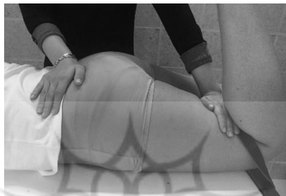
شکل ۱. نحوه اندازه‌گیری بیشینه قدرت ایزومتریک عضله سرینی بزرگ

انجام آزمون از بندهای محکم غیرقابل ارتجاع که از یک سمت به انتهای اندام موردنظر و از طرف دیگر به پایه تخت بسته می‌شد استفاده شد. این امر باعث اعتباربخشی بیشتر به آزمون‌های سنجش قدرت ایزومتریک با دینامومتر دستی می‌گردد (۲۶). از آزمودنی خواسته می‌شد که ۵ شماره با نهایت قدرت به دینامومتر دستی دیجیتال مدل JTECH Medical MN084_A Commander که در انتهای اندام و زیر بند ثابت‌کننده قرار داشت فشار وارد کند. مجموعاً سه بار اندازه‌گیری قدرت با انجام باز کردن بیش از حد ران به مقدار ۲۰ درجه، انقباضات ۵ ثانیه‌ای و استراحت ۳۰ ثانیه‌ای بین تکرارها انجام شد. میانگین سه عدد به دست آمده به عنوان ماکزیمم قدرت ایزومتریک عضله برحسب نیوتن ثبت گردید (۲۷). عدد به دست آمده بر وزن فرد برحسب نیوتن تقسیم شده و ضربدر عدد ۱۰۰ شد و ماکزیمم قدرت عضله برحسب درصد وزن بدن گزارش گردید.