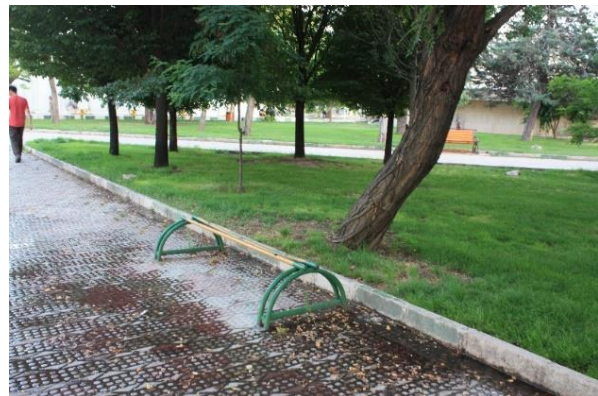
تصویر ۳: نمایی از پارک شهدای هادی آباد شهر قزوین