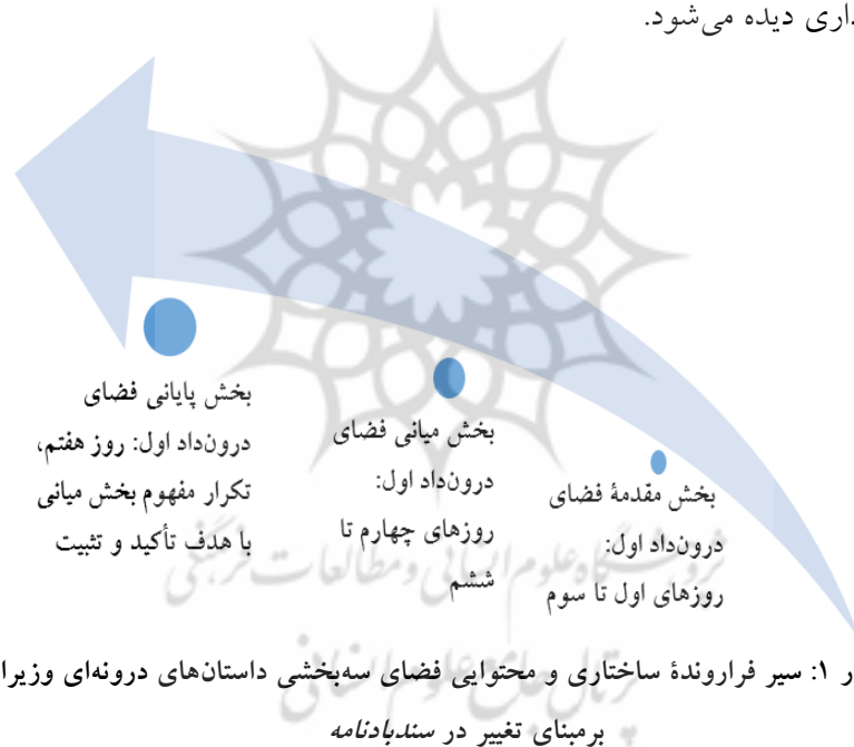
Diagram 1: Change-based structural and content evolution of the three-part space of Viziers' embedded stories in Sindbad-Nameh

روز هفتم، روز سخن از تدبیر و نکته‌سنجی است. وزیر در مقدمه، با صراحت، زن (کنیزک) را شیطان‌صفت توصیف و پادشاه را به تدبیر و تفکر دعوت می‌کند. روایت‌های وزیر هفتم که بخش سوم (پایانی) فضای درون‌داد اول است، تکرار و تأکید بر مفاهیم بخش دوم فضای درون‌داد با هدف تثبیت آن‌هاست. در روز هفتم، وزیر هفتم نقش‌آفرینی می‌کند و مهر ختامی بر تمام تلاش‌های شش وزیر قبل از خود می‌زند. در این روز، بخش سوم (پایانی) فضای درون‌داد اول اجرا می‌شود و حرف‌های اساسی وزیران در این مرحله به سرانجام می‌رسد و از روز هشتم در صحنه‌گردانان داستان تغییر معناداری دیده می‌شود.