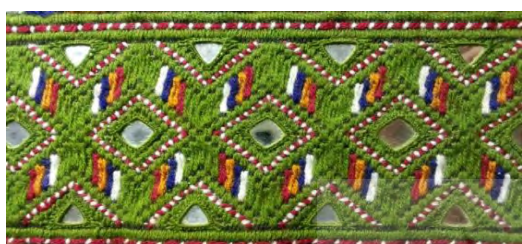
شکل ۴. نمونه نقوش تجریدی سوزن‌دوزی به بلوچ همراه آینه‌کاری

http://1000dokan.com/%D8%B3%D9%88%D8%B2%D9%86-