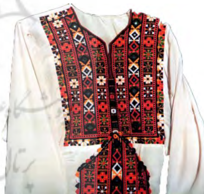
شکل ۳. رنگ بندی‌های فام گرم در سوزن‌دوزی سنتی بلوچ

رنگ: رنگ‌های گرم از طیف نارنجی و قرمز شنگرف به‌صورت فراوانی در سوزن‌دوزی‌های سنتی بلوچ به کار می‌رفته است. این رنگ‌ها در سوزن‌دوزی‌های معاصر دستخوش تغییراتی شده اما، ملاک در ارزیابی زیبایی‌شناسانه آن‌ها نمونه‌های اصیل و سنتی است. البته این رنگ‌ها در کنار استفاده اندک از رنگ‌های سرد و به‌خصوص سیاه و سبز است که معنی می‌یابند. (شکل ۳)