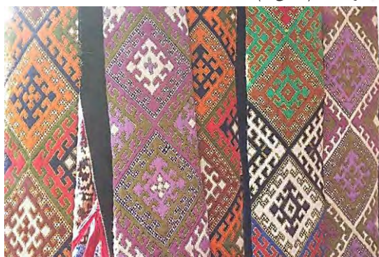
شکل ۵. نمونه ای از نقوش سوزن‌دوزی بلوچ

اندازه: جزئیات کوچک (ظرافت) مشخصه بارز فرهنگ بصری بلوچ است و به‌خوبی در سوزن‌دوزی‌های این منطقه نیز نمود یافته است. تمایل به پرکاری و بافت متراکم خود می‌تواند موید کاربرد بیشتر ظرافت جهت حفظ زیبایی شناسی بصری این آثار باشد. (شکل ۵)