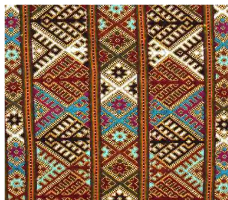
شکل ۲. خطوط راست و شکسته در سوزن‌دوزی بلوچ

میزان انتزاع یا برخورد رئال: مردمان بلوچ با هنرهای تصویری خود کاملاً انتزاعی و تجریدی اما متأثر از طبیعت منطقه خود برخورد می‌کنند. نمی‌توان به انتزاع مدرن در این رویکرد ارجاع نمود. انتزاع سوزن‌دوزی بلوچ حاصل گذشت تاریخ بر این فرهنگ است. (شکل ۴)