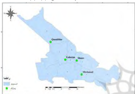
شکل ۲. موقعیت پارک‌های مورد مطالعه در شهر تبریز

در این پژوهش ۴ پارک (پارک‌های شمس، میرداماد، قوناخار باغی و فجر) به‌عنوان نمونه از بین کل پارک‌های منطقه‌ای جهت انجام تحقیق انتخاب و به اختصار توضیح داده می‌شود.