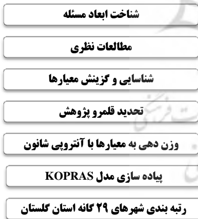
شکل ۱. چارچوب فرآیندی تحقیق

گلستیس و کلتوس ۲ (۲۰۱۱) در مقاله «سنجش میزان توسعه و نابرابری منطقه‌ای در مناطق پیرامونی یونان با استفاده از تکنیک تحلیل عاملی و خوشه‌ای»، مناطق یونان را به لحاظ شاخص‌های اقتصادی و اجتماعی بررسی کرده و به این نتیجه رسیدند که دوره زمانی ۲۰۰۷-۱۹۹۵ بین مناطق یونان همگرایی وجود ندارد و شاخص‌های توسعه در بین مناطق به صورت عادلانه توزیع نشده است.