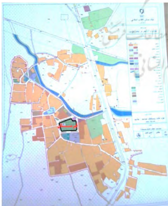
شکل ۲: نقشه کاربری اراضی روستای شوسنی شکل