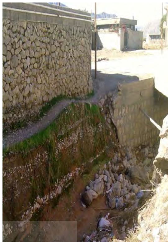
شکل ۳: شبکه آبراهه در روستای ضامنی

نشده جمع‌آوری نمی‌شوند و بیشتر در زمین‌های خالی کنار واحدهای مسکونی ریخته می‌شوند. هر چند عملکرد دهیاری در این زمینه با توفیقاتی همراه بوده است، اما نتوانسته رضایت نسبی روستاییان را جلب کند. رها کردن و انباشت زباله در محیط زندگی، سبب پدید آمدن مشکلات و مسایل بهداشتی برای جامعه می‌شود و زباله انباشت شده می‌تواند مکانی برای انتقال بسیاری از بیماری‌ها به‌وسیله حشرات و جانوران موذی باشد (دربان آستانه، ۱۳۸۷: ۱۹). در رابطه با راکد ماندن آب و آب‌گرفتی به‌غیر از محدوده اجرای طرح‌های، این مشکل را در قسمت غربی بابامیدان زیر راه، قسمت شرقی بابامیدان سفلی، باباگورین و جاهای محدودی از بابامیدان علیا به وضوح می‌توان دید. خروجی شبکه زه‌کشی روستا به زمین‌های کشاورزی ختم می‌شود که سبب شده منظر روستا را از نظر زیست‌محیطی و زیبایی خدشه‌دار کند. هر چند طبق گفته‌های دهیار، محدوده‌های آب‌گرفتگی در فصول بارش با لودر پر می‌شوند. البته مشکل جاری شدن آب‌های سطحی در بخش‌هایی از روستا از مشکل دومی حادث می‌شود که به دلیل عدم سیستم زه‌کشی و ساخت جدول در روستای یاد شده است. در مجموع، طرح‌های روستایی در ابعاد زیست‌محیطی در دو روستای تحقیق موفق نبوده است.